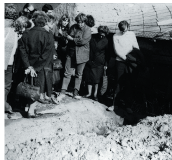
Obr. 2. Komisia na výskume v antickej Gerulate.