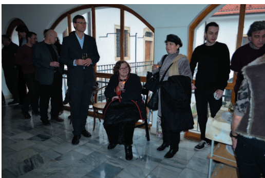
Obr. 5. SNM-Archeologické múzeum, január 2012 – kolokvium o germánskej keramike.