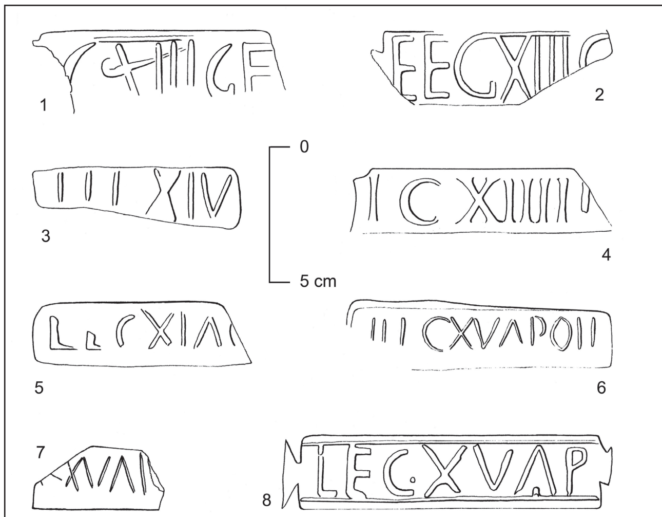
Obr. 2. Stupava. 1, 2: kolky XIII. légie; 3-5: výber kolkov XIII. légie; 6-8: výber kolkov XV. légie. Kresby: P. Šimčík

Légia X Gemina bola na strednom Podunajsku po prvý krát umiestnená v roku 62, a to konkrétne v Carnunte, kde nahradila légiu XV Apollinaris, ktorá bola prevelená na východ. Za vlády cisára Galbu roku 68 bola prevelená do Itálie. Jej pozíciu v Carnunte zaujala légia VII Gemina. V roku 89 dostala légia od cisára Domitiana prívlastok Pia Fidelis. Do Panónie bola znovu presunutá v roku 101/102. Najprv sídlila v Aquincu, okolo roku 118 sa jej sídelným miestom stala Vindobona, kde zotrvala až do konca doby rímskej (Brandl 1999, 116-138; Mosser 2005, 140). Stavebnú keramikú s kolkami X. légie nachádzame na viacerých miestach juhozápadného Slovenska, napríklad v Iži (Rajtár 1987, 54), na Devíne (Plachá – Pieta 1986, 350), v Milanovciach (Kolník 1959, 41) a Cíferi-Páci (Kolník 1975, 8). Na juh od Dunaja možno väčší výskyt kolkov X. légie konštatovať predovšetkým v severnej časti provincie (Brandl 1999, Karte 14), vrátane Gerulaty (Kraskovská 1991, 50).