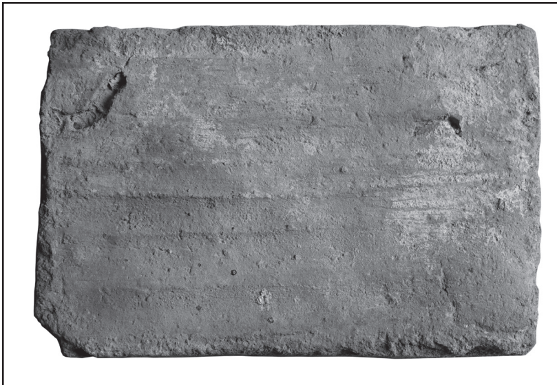
Obr. 2 – Banská Štiavnica-Hellov dom, renesančná tehla zo začiatku 17. storočia.

ky slúžili na lepšie prepojenie malty s tehľami), zasluhujú si našu pozornosť. V banskoštiavnickom regióne evidujeme dva výrazné varianty prstovaných tehál: