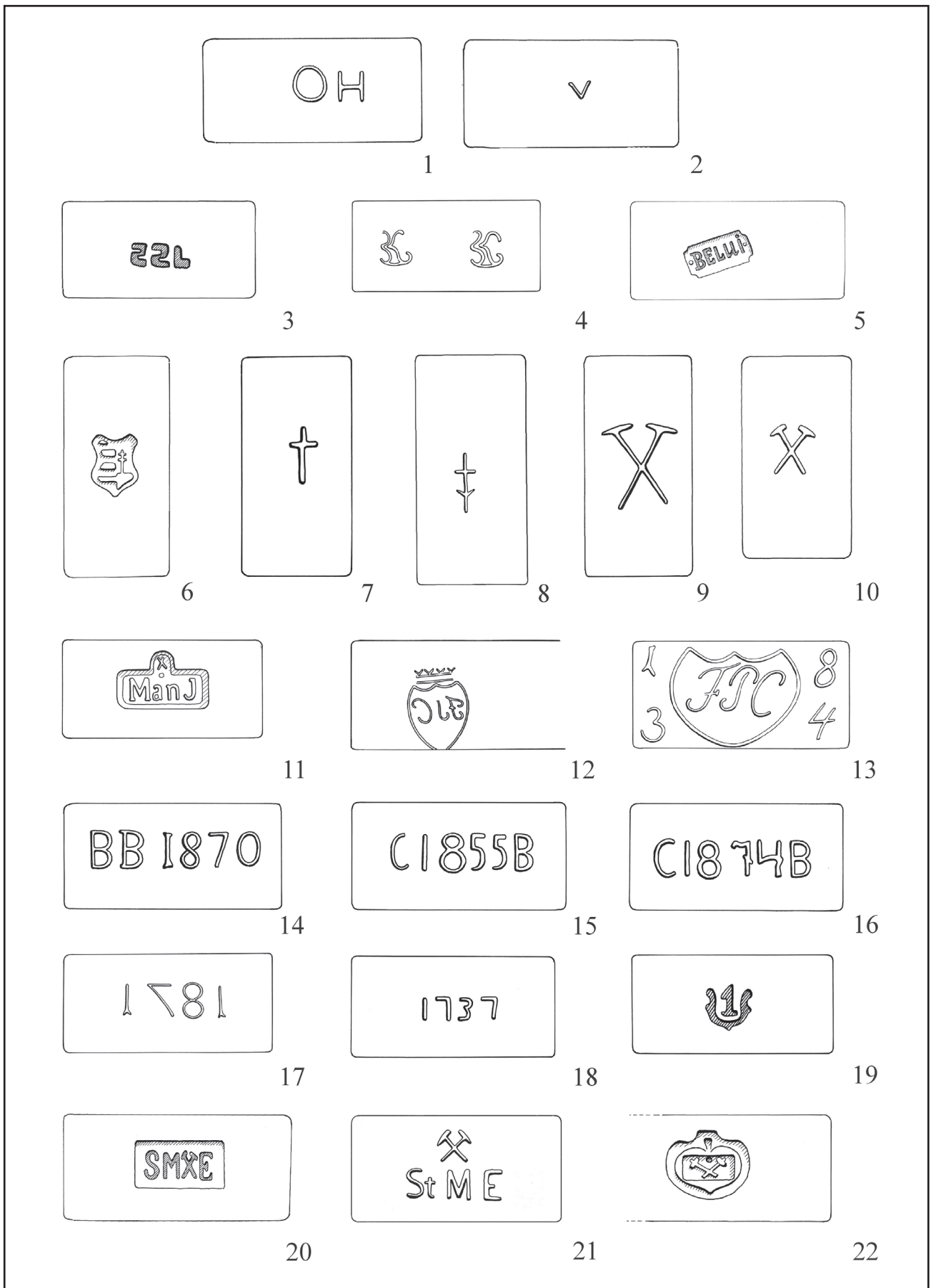
Obr. 4 – Výber značkových tehál z banskoštiavnického regiónu. Kresby: D. Nagyová