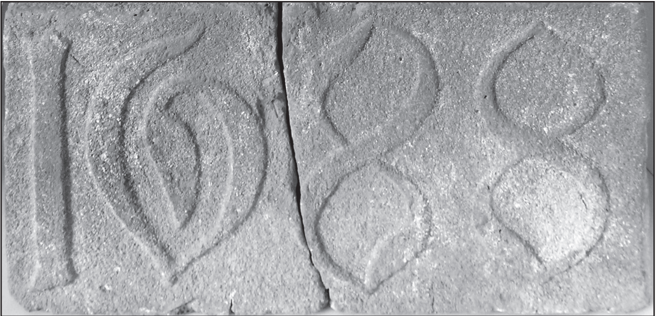
Obr. 2 – Tehla z roku 1688.

POSPECHOVÁ – WITTGRÜBER 2004 – P. Pospěchová – P. Wittgrüber (Zost.): Pálená krása. Tehly a tehliarske značky. Pezinok 2004.