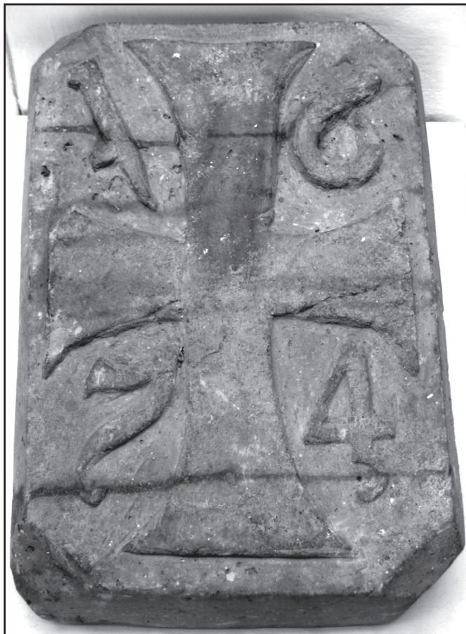
Obr. 1 – Tehla z roku 1674.

Tehly získané výskumom národnej kultúrnej pamiatky Kostola sv. Michala Archanjela v Povedime patria medzi zaujímavé stavebné materiály, a to svojim datovaním, ako aj výzdobou. V prípade datovania ide o jedny z najstarších doteraz známych tehál na Slovensku a v súčasnosti nemáme ani analógie k reliéfnu zdobeným úlomkom tehál. Záverom podotýkame, že výrobca tehál je neznámy a išlo o objednávku stavebníka, ktorým bolo Prepošstvo Panny Márie v Novom Meste nad Váhom.