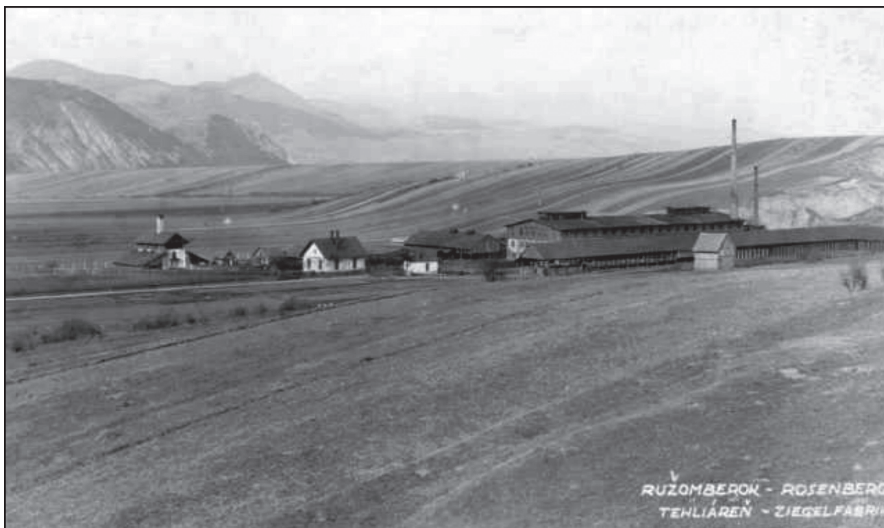
Obr. 6 – Dobový pohľad na tehelňu v Ružomberku (podľa www.speleork.sk)