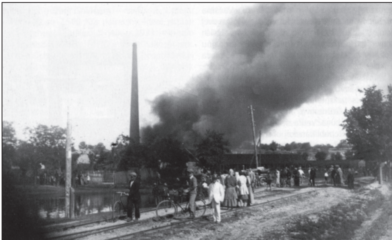
Obr. 7 – Senec. Výbuch nahromadeného plynu v tehelni v roku 1932 (podľa Fedor a kol. 2004, 106)

Základom závodu, ktorý bol zoštatnený v roku 1948, bol podnik Tehelňa , tvoriaci súčasť majetkovej podstaty firmy Carpathia úč. spoločnosť so sídlom v Prievidzi. Akcionármi tehelne boli Slovenská banka v Bratislave s 35 % podielmi, bratia Heumannovi z Prievidze a rôzni drobní účastníci s 5 % podielmi (Blaho 1971, 62, 63).