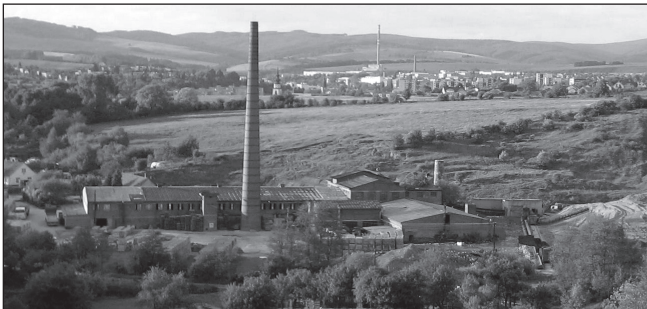
Obr. 5 – Tehelňa v Myjave