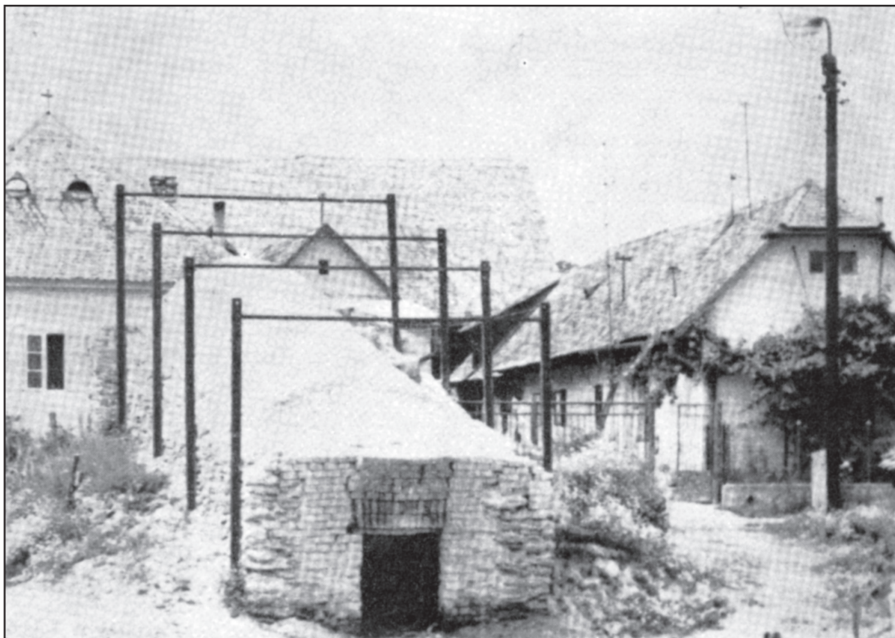
Obr. 3 – Hrnčiarske Zalužany. Dedinská tehliarska pec. Stav v roku 1970 (podľa Milov 1970, 33)

lisovňou, Kellerovými sušiarňami a kruhovou pecou. V roku 1958 bola tehelná začlenená do Západoslovenských tehelní, n. p. Pezinok (Slimák a kol. 1976, 27). Za Grünmandlového vlastníctva tehelná značila tehly značkou HG. Okrem tejto bola v poli Záhumenica smerom na Farské ešte Lechpérova tehelná, ktorá však skoro zanikla. K známym tehliarským rodinám, bývajúcim priamo v Grünmandlovej tehelni patrili rodiny Uhrincov, Váľkov a Včelkov (Chochoľáčková 1992, 24).