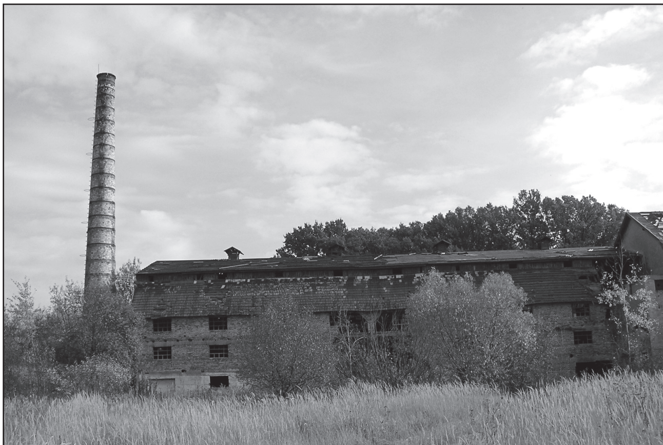
Obr. 4 – Tehelňa v Maštinci. Stav v roku 2006.