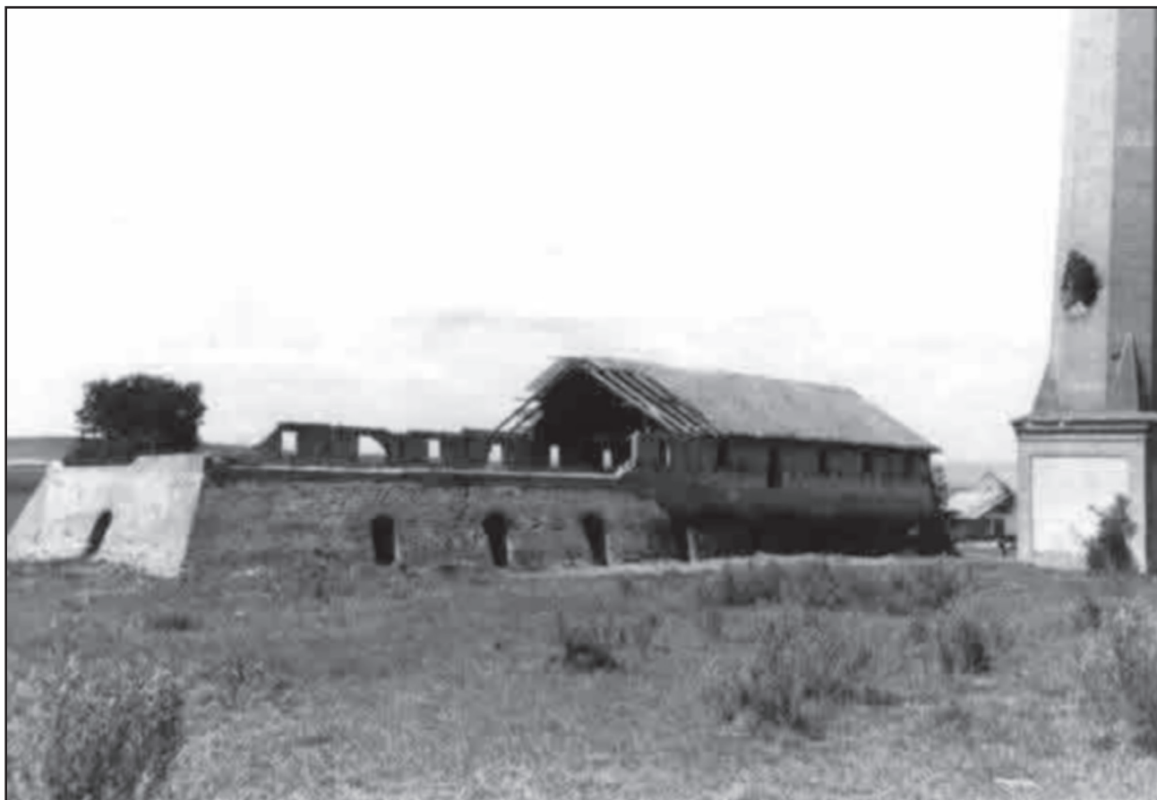
Obr. 2 – Tehelňa vo Fabianke po 2. svetovej vojne

do špecializovaných podnikov na priemyselnú, bytovú a inžiniersku výstavbu (Vaníková 1993, 122).