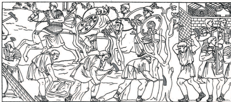
Obr. 1 Scény z Trajánovho stĺpa s vyobrazeniami dolabier (podľa: B. Brizziho).