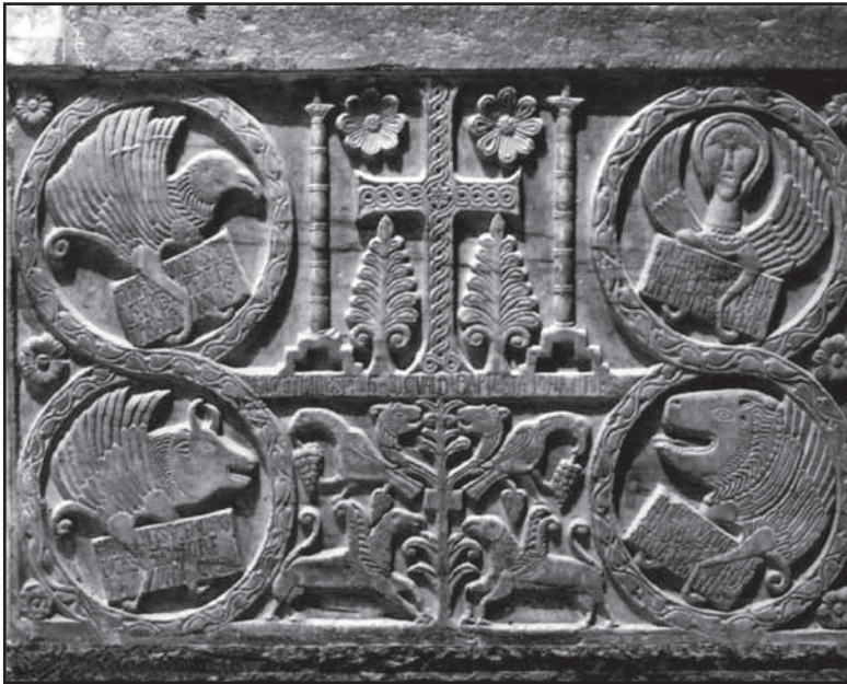
Obr. 1 Cividale del Friuli. Callistovo baptistérium.

Záujem o stredodunajský región ako christianizačné územie prejavila aj druhá strana. Iste nebolo náhodou, že v čele synody, ktorá sa uskutočnila v roku 796 „na brehoch Dunaja“, stál akvilejský patriarcha Paulinus, ktorý po návrate spísal o zasadaní protokol (Kožiak 2006, 131–132; Múcska 2006, 297). Hoci v roku 811 cisár Karol Veľký určil ako hranicu medzi misijnými sférami Aquileie a Pasova riekou Drávu (MMFH III, 1969, 19), evidentne to neznamenalo úplné vyprázdnenie stredodunajského regiónu misionármi z jadranskej oblasti, keďže ešte o pol storočia neskôr uviedol moravský panovník Rastislav v známom liste byzantskému cisárovi Michalovi III., že v krajine pôsobia kňazi „z Vlách, Grécka i Nemiec“ (Ratkoš 1968, 237; MMFH 1967, 144). „Vlachy“ sú bádateľmi jednoznačne identifikované ako severné Taliansko (Havlík 1970, 117; MMFH 1967, 144, pozn. 7; Vavřínek 1963, 467–468).