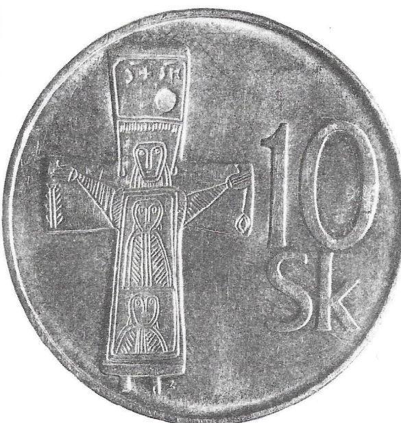
Obr. 2. Desiat'korunová minca s mačianskym krížikom.