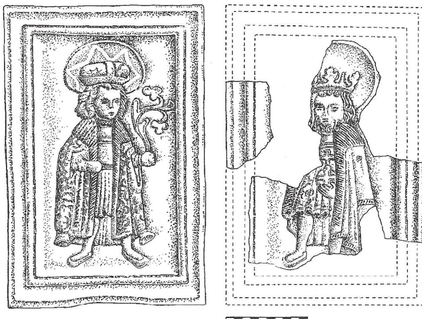
Obr. 2. Kachlica s reliéfom sv. Imricha z Devína (vľavo, podľa Egyházy-Jurovská - Fűryová 1993) a kachlica s reliéfom sv. Ladislava (rekonštrukcia podľa nálezov z hradu Branč a mestského hradu v Kremnici)