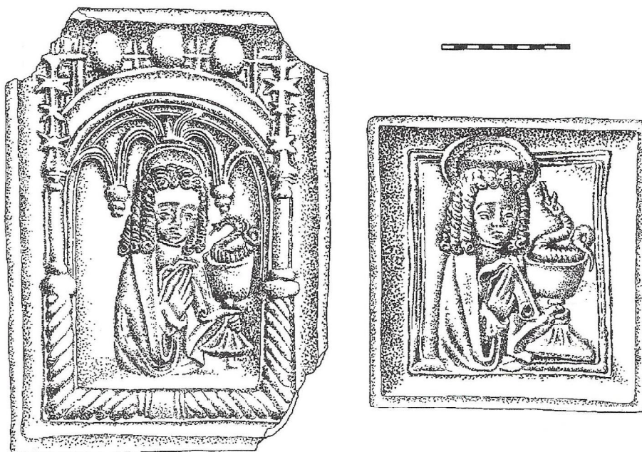
Obr. 1. Reliéf sv. Jána na kachliciach z Banskej Bystrice, použitý v zdobenom výklenku a samostatne na štvorcovej doske (podľa: Holčík 1978)