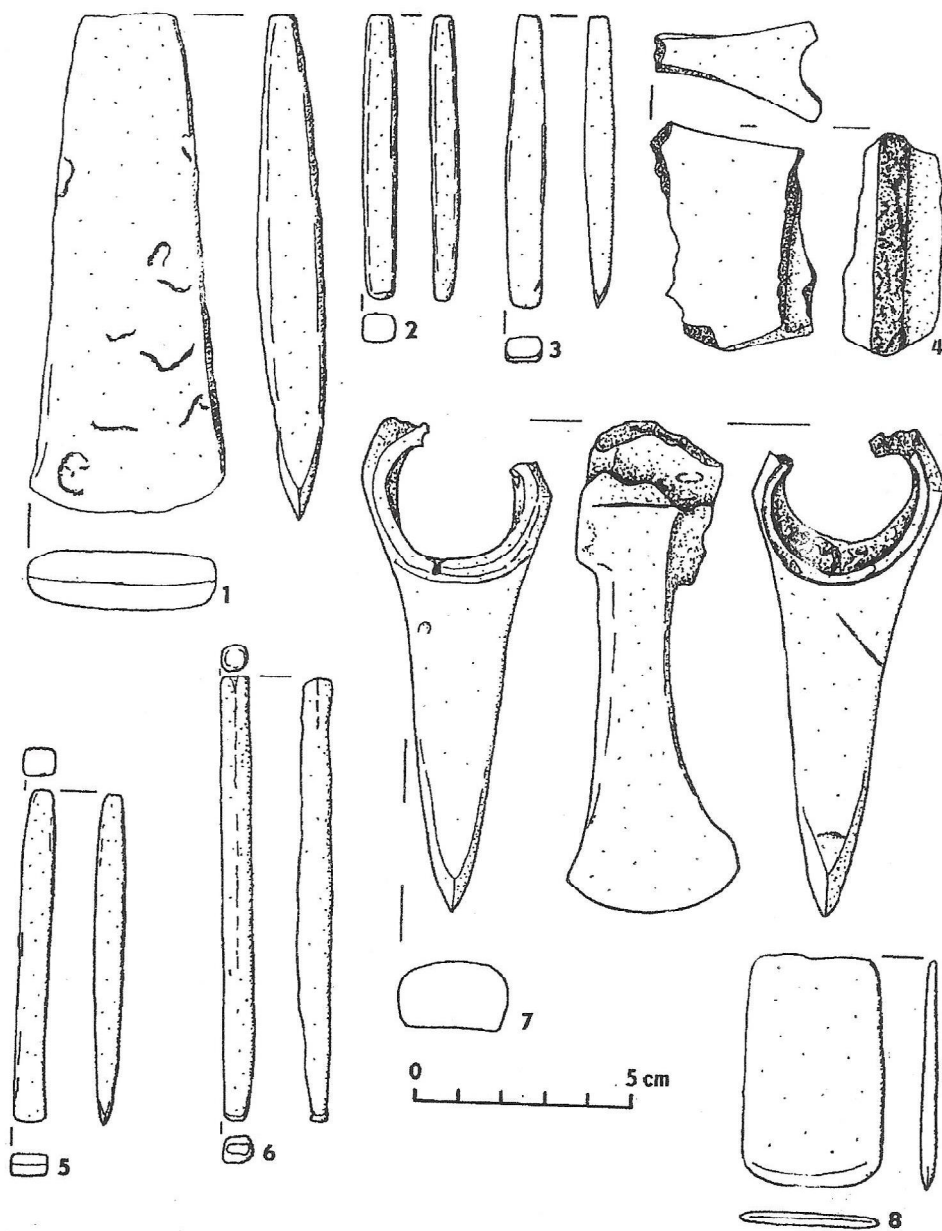
Obr. 2. 1 - Pezinok, 2 - Trnava-Horné Pole, 3 - Dolné Orešany-Velký Želczník, 4 a 6 - Smolenice-Molpír, 5 - Veľký Grob, 7 - Tupá, 8 - Bratislava-Dúbravka (Veľká lúka)

podporiť aj predpoklad o surovine, pripravenej v niektorom z mladších období praveku či doby protodejinnej na druhotné pretavenie.