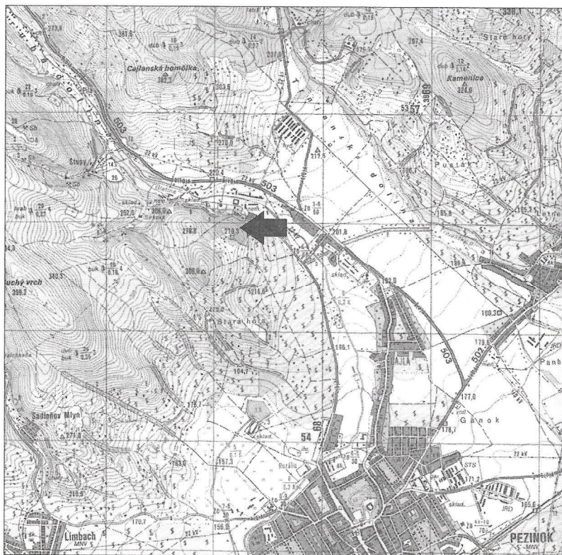
Obr. 1 Pezinok-Cajla, poloha Starý zámok – kóta 279,3 m.n.m (mapa M-33-143-A-b, M-33-143-B-a, M – 1:25000) s označením miesta nálezu šípkou

V roku 2005 sa podarilo v Malých Karpatoch pri Pezinku na lokalite Starý Zámok, nad areálom Pinelovej nemocnice v chotári Pezinok-Cajla (obr. 1) pri prieskume detektorom kovov objaviť nepoškodenú bronzovú/medenú sponu. Ide o galo-rímsky typ spony šarnierovej konštrukcie Feugère 21a1 Alèsia (Feugère 1985, 304), resp. Alèsia Ia2 (Demetz 1999, 157) s trojuholníkovým plechovým lúčikom, zdobeným jemným gravírovaním vo forme šikmo sa prekrývajúcich rýh, vytvárajúcich sieťový motív. 1 Ide o sponu, ktorá je typická a z chronologického hľadiska veľmi dôležitá pre datovanie neskorej doby laténskej na Slovensku.