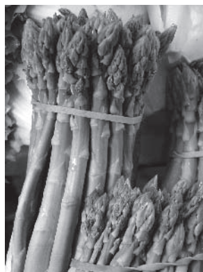
Obr. 3 Špargľa dnes

Uloženie: Múzeum maďarskej kultúry a Podunajska, Komárno