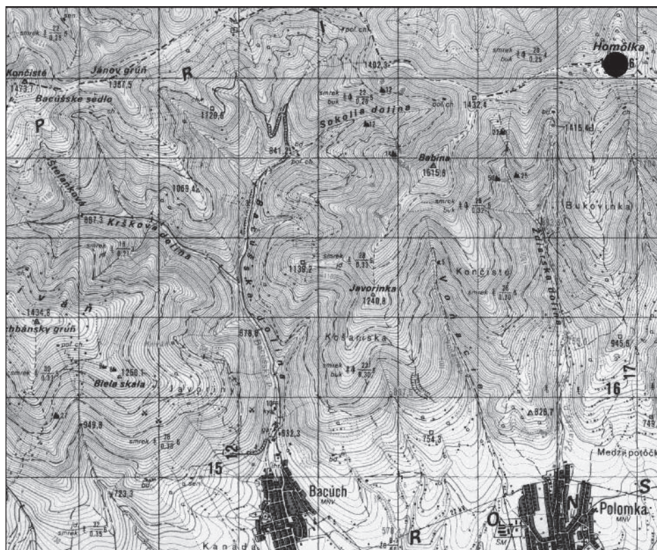
Obr. 1 Nízke Tatry, Homôlka (mapa 1:25000). Miesto nálezcu označené krúžkom