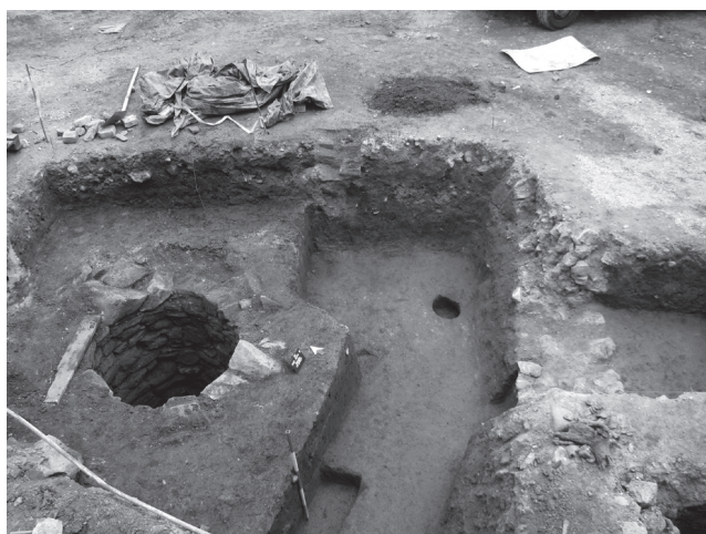
Obr. 4 Pezinok, Radničné námestie 9. Sonda VII/2007 na nádvorí