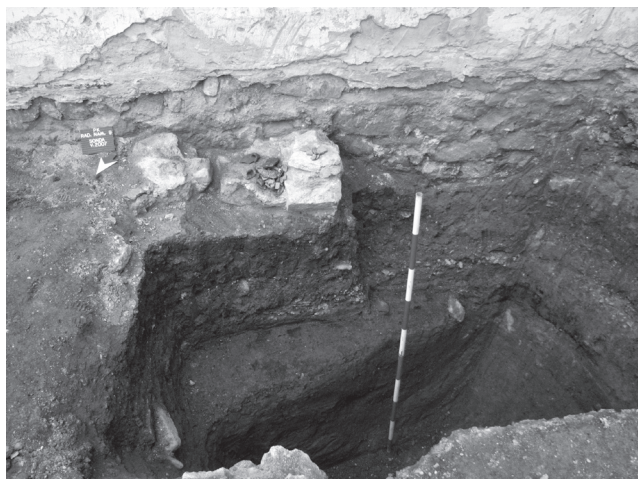
Obr. 3 Pezinok, Radničné námestie 9. Sonda V/2007 na nádvorí

Ďalej vo vzdialenosti len 100 cm od severného líca objektu 4/07 bol odkrytý objekt 5/07 – kamenný základ obvodového múru, ktorý bol v nadzemnej časti postavený z tehál. Základ múru bol, po celej svojej zachovanej dĺžke, súbežný s predošlým základom. Aj jeho zachovaná koruna a jej priebeh bol viditeľný v celom rozsahu (aj mimo sondy) na ploche nádvorí. Tento múr bol vonkajším obvodovým múrom prístavby asanovanej pred začatím výskumu. Prístavba pochádzala asi zo začiatku 20. storočia a bola o niečo širšia ako jej predchodkyňa. Zistené rozmery múru boli: dĺžka – 895 cm (v sonde len na jej šírku – 80 cm), šírka – 90 cm a zachovaná výška – 110 cm. Jeho sekundárna previazanosť s východnou obvodovou stenou meštianskeho domu bola evidentná.