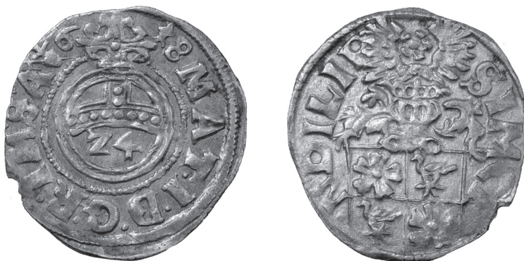
Obr. 9 Grófstvo Lippe, Simon VII. (1613 – 1627), groš 1618 (Poklad č. 2)