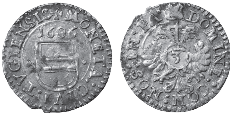
Obr. 16 Švajčiarsko, mesto Zug, 3-grajciar 1606 (Poklad č. 4)