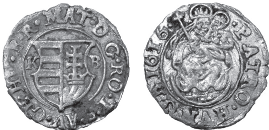
Obr. 4 Uhorsko, Matej II. (1608 – 1619), Kremnica, denár 1616 (Poklad č. 2)