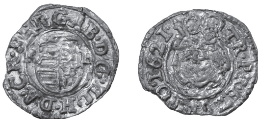
Obr. 6 Uhorsko, Gabriel Bethlen (1613 – 1629), Kremnica, denár 1621 (Poklad č. 2)