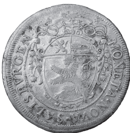
Obr. 14 Arcibiskupstvo Salzburg, Paris von Lodron (1619 – 1653), Salzburg, 60-grajciar 1621 (Poklad č. 4)