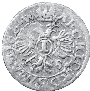
Obr. 12 Morava, Ferdinand II. (1619 – 1637), Brno, grajciar 1624 (Poklad č. 4)