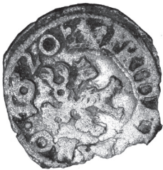
Obr. 11 Čechy, Fridrich Falcký (1619 – 1620), Kutná Hora, jednostranný biely peniaz 1620 (Poklad č. 3)