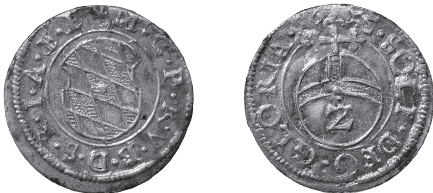
Obr. 15 Bavorsko, Maximilián I. ako kurfist (1623 – 1651), München, ½-batzen 1625? (Poklad č. 4)