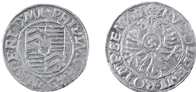
Obr. 3 Hanau-Münzenberg, Filip Ludvig I. (1561 – 1580), 3-grajciar bez letopočtu (Poklad č. 1)