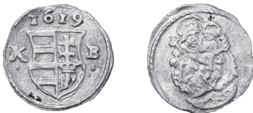
Obr. 5 Uhorsko, Matej II. (1608 – 1619), Kremnica, obolus 1619 (Poklad č. 2)