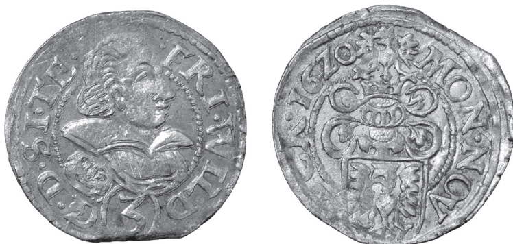
Obr. 8 Poľsko, Štetínske kniežatstvo, Fridrich Wilhelm (1617 – 1625), Štetín, 3-grajciar 1620 (Poklad č. 2)