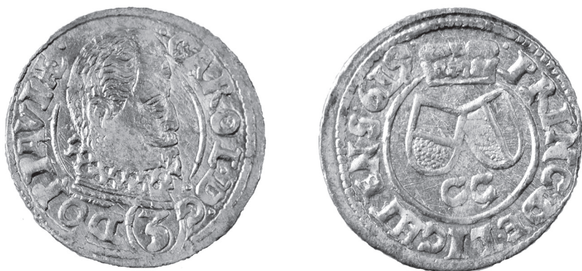
Obr. 2 Opavsko, Karol Liechtenstein (1614 – 1627), Opava, 3-grajciar 1619 (Poklad č. 1)