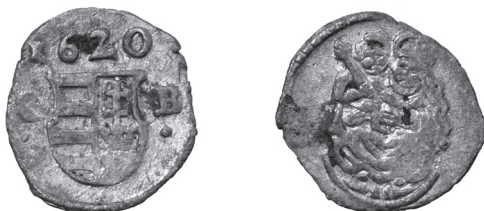
Obr. 7 Uhorsko, Gabriel Bethlen (1613 – 1629), Kremnica, obolus 1620. (Poklad č. 2)