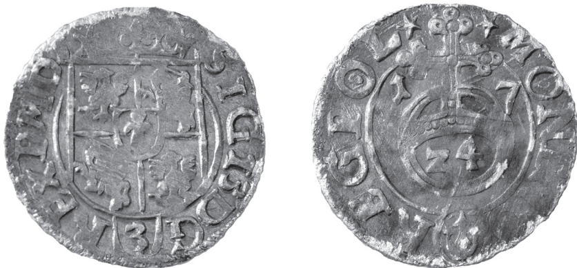
Obr. 1 Poľsko, Žigmund III. Vasa (1587 – 1632), Bydgoszcz, poltorák 1617 (Poklad č. 1)