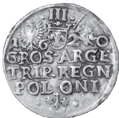
Obr. 13 Polsko, Žigmund III. (1587 – 1632), Krakov, 3-groš 1620 (Poklad č. 4)