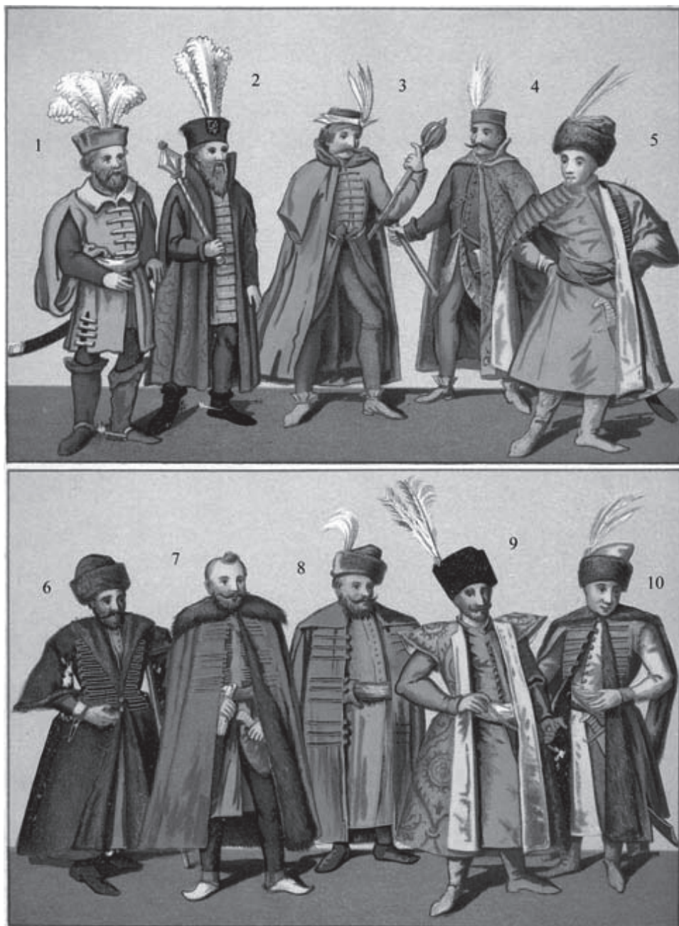
Obr. 8 Muži z rodu Hallerovcov žijúci v 15. – 17. storočí (Turul 1886). Na vyobrazení sú označení číslom 4 – Gabriel Haller († 1608), 5 – Štefan Haller (nar. 1560), 6 – Michal Haller († 1596), 9 – Ján Haller († 1697), 10 – Peter Haller († asi 1670)