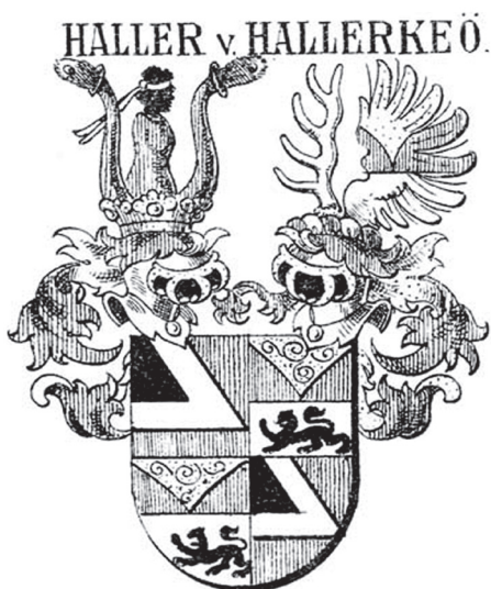
Obr. 6 Rodový erb Hallerovcov uverejnený v Siebmacherovej zbierke erbov (Uhorsko, Sedmohradsko, Chorvátsko, Slavónsko)