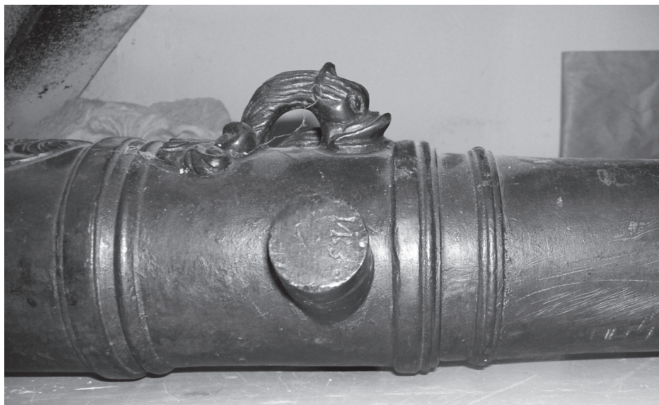
Obr. 2 Delo, detail označenia VI:5, resp. N:5

Hallerovci sú pôvodným nemeckým rodom pochádzajúcim z Norimbergu. Ruprecht von Haller († 1504) zaradil medzi svojich rytierov kráľ Matej (Mathias) a počas jeho vlády prišiel Ruprecht do Pešti (Ofen) a neskôr sa stal zakladateľom váženej línie grófskeho rodu