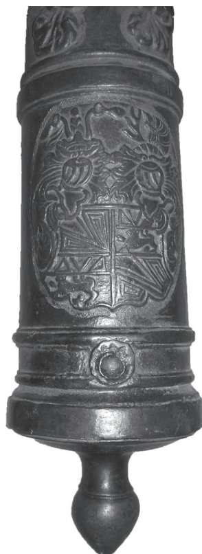
Obr. 3 Delo, detail rodového erbu