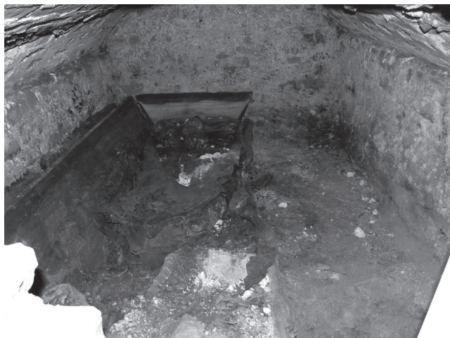
Obr. 3 Pezinok. Kostol Nanebovzatia Panny Márie. Interiér krypty po otvorení