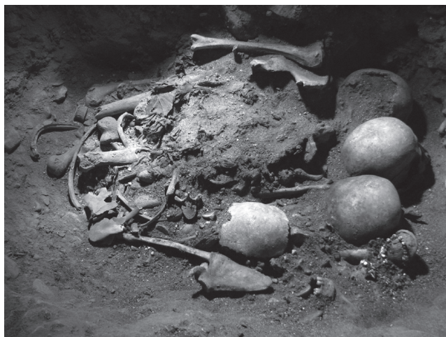
Obr. 4 Pezinok. Kostol Nanebovzatia Panny Márie. Obsah sondy I/2007