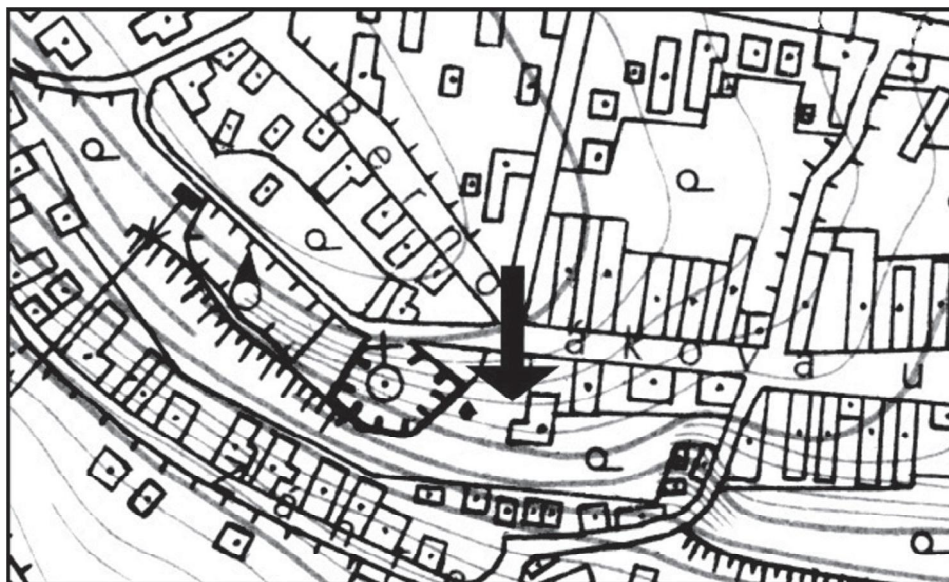
Obr. 1 Bernolákovo. Plán lokality s miestom nálezu urny