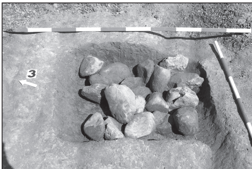
Obr. 2 Prešov - Solivar. Pec zistená v roku 2009.

ťažko vieme predstaviť pri spracovávaní železa, kde poznáme silne prepálené dlažby pražníc resp. taviacich piecok, napr. aj priamo zo sídliska v Ostrovanoch – Medzanoch. (Lamiová-Schmiedlová 1987, 28). Štvorhranné pece boli známe a používané v dobe rímskej na rozsiahlom území a to nie len u jedného etnika. Dá sa predpokladať, že tvorili dôležitý prvok v živote osady, ktorý pravdepodobne súvisel s jej hospodárskym zabezpečením. Nie je však možné vylúčiť ani kultovú funkciu. Problematické je aj datovanie piecok pre absenciu výraznejších nálezov v nich. Zdá sa však pravdepodobným, že doteraz známe východoslovenské nálezy môžeme spájať s osídlením mladšej doby rímskej.