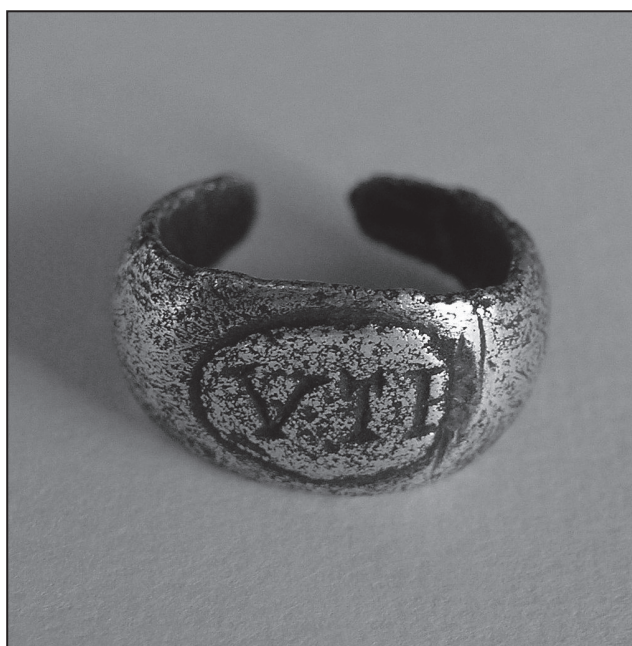
Obr. 1. Liptov. Strieborný prsteň.

V zbierkach členov Slovenskej numizmatickej spoločnosti pri SAV sa neraz objavia artefakty, ktoré sa od numizmatických exemplárov líšia. Časť z nich patrí do kategórie hnutelných pamiatok hmotnej kultúry, získaných nelegálnou činnosťou vykrádačov kultúrneho dedičstva pomocou detektorov kovov. Na Slovensku sa spomínané vyhľadávanie archeologických nálezov rozmohlo najmä od začiatku 90-tych rokov 20. storočia a napriek prísne- mu porušovaniu novelizovaného zákona č. 49/2002 Z. z. o ochrane pamiatkového fondu toto masové rozkrá- danie archeologických nálezísk pokračuje dodnes. V predloženom príspevku sa venujeme jednému z nálezov, získanému vyššie uvedeným spôsobom – drobnému prsteňu. Našli ho spolu s viacerými uhorskými a rímskymi mincami „v blízkosti Havránku“, známej polykultúrnej archeologickej lokality ležiacej v katastri obce Liptovská Sielnica-Liptovská Mara (okr. Liptovský Mikuláš), s dominantným osídlením nositeľmi púchovskej kultúry z 2. storočia pred Kr. až 2. storočia po Kr. (Pieta 1996; 2008, 194 nn.) 2 . Kým nálezové okolnosti viacerých tu obja- vených mincí sú problematické, neplatí to pre analyzovaný prsteň, pri ktorom sa dochoval štítok s uvedením lokality „Liptovská Mara“.