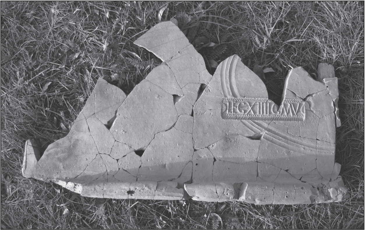
Abb. 3 Römischer Dachziegel der XIV. Legion GMV aus Zohor.