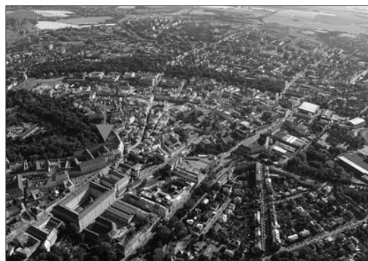
Obr. 1 Olomouc. Kostel Panny Marie Sněžné označen šipkou.

Realizovaný výzkum zjistil, že na skalním podloží, uměle přitesaném do roviny, leželo souvrství o mocnosti 0,7-1,0 m kulturních vrstev odpadního charakteru z 9. a 10. století. Vrstvy obsahovaly zlomky keramických nádob, zvířecí kosti i zlomky hliněných omazávek stěn obydlí. Zajímavým dokladem dálkových kontaktů je fragment su-