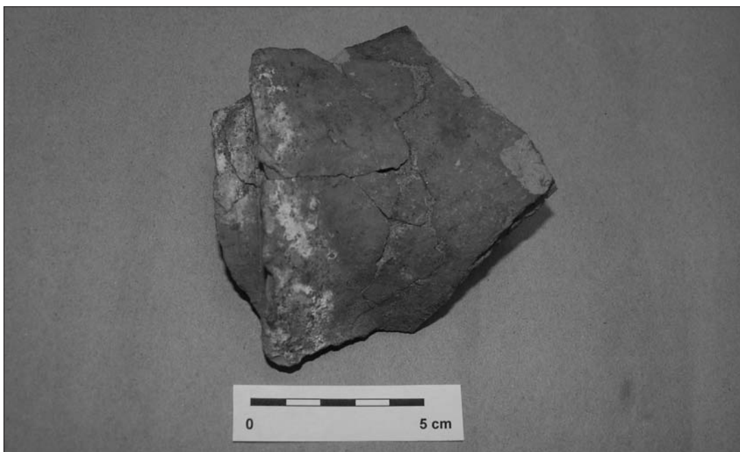
Obr. 2. Olomouc, kostel Panny Marie Sněžné. Zlomek střešní krytiny s vyhlazeným povrchem.

rového baltského jantaru. Kulturní vrstvy přiléhaly až do těsné blízkosti přibližně 6 m širokého a 1,8 m hlubokého příkopu zasekaného do skály, objeveného v prostoru západní terasy s balustrádou. Jedná se o pozůstatek opevnění Předhradí, jehož počátky spadají do velkomoravského období, a který v nejužším krčku šíje Předhradí sloužil až do 14. století, kdy byl zasypán a nahrazen novou kamennou hradbou s tzv. Novou bránou. Další pozůstatek původního opevnění raně středověkého hradu byl odkrytý pod východní terasou, tvořilo jej 1,4-1,5 m široké kamenné vrstvené základové zdivo románské hradby se severo-jihní orientací.