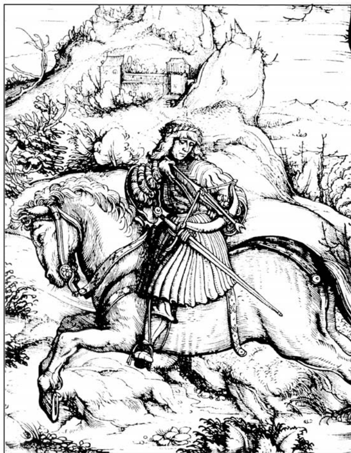
Obr. 4 Strelec na koni s kušou s vloženou strelou s vidlicovitým hrotom. Grafika zo 16. storočia. Podľa L. Šlauka.

Výrazne menší počet v zbierkach uložených a publikovaných vidlicových hrotov striel kuší v porovnaní s klasickými klinovitými (Slivka 1980, 240) na lov, boj aj cvičnú strelbu používanými strelkami s tulajkou a ostrím kosoštvorcového prierezu, tzv. typ bodkin (typ T 1-5 a T 2-5 podľa B. Zimmermann 2000, 46-48, 51-53 alebo skupina B III podľa R. Krajčíc 2003), poukazuje na ich špecifickú funkciu a prípadnú stratu na miestach, ktoré sú zvyčajne mimo bežného okruhu záujmu archeológov (napr. lovecké aj dnes zalesnené revíry alebo polia). Publikované nálezy, napr. z Gajar-Posádky (Polla 1962, obr. 7: 9, 17:5), Sezimova Ústí (Krajčíc 2003, obr. 151: Va), Plačic, Opočna nad Jizerou (Brych 1998, 55) a hradu Cvilín (ŠelenburgúPřihoda 1932, 65, obr. 50) sú zväčša datované do priebehu 15. storočia, kam možno zrejme vzhľadom na kvalitnú kováčsku prácu zaradiť aj nálezy z Bratislavy, prípadne s miernym presahom na koniec 14. či na začiatok 16. storočia. Variabilita hrotov z Devínskej Kobyly, z ktorých všetky možno zaradiť medzi ťažké kušové hroty, ktoré sa podľa R. Přihodu (Přihoda 1932, 53) objavili pred koncom 14. storočia (3 ks, 3 varianty – obr. 2: 2-4), poukazuje na ich individuálnu výrobu, azda nie vždy iba špecializovanými zbrojármi.