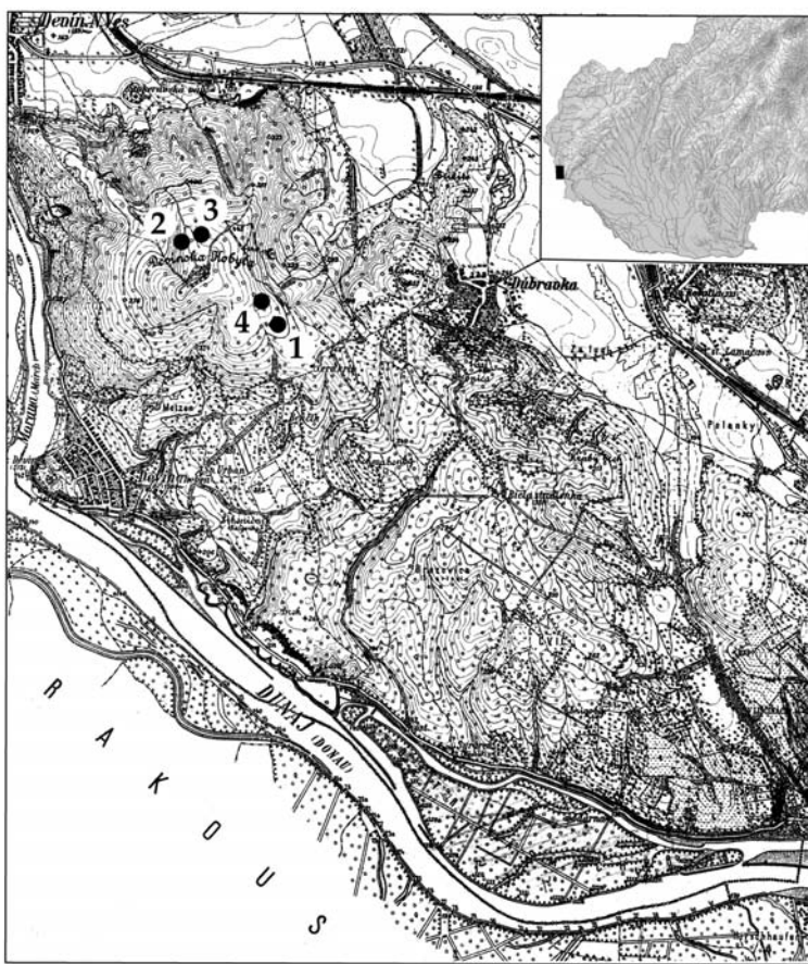
Obr. 1 Bratislava, časť Karlova Ves, Devín, Dúbravka a Devínska Nová Ves. Devínska Kobyla (Devínske Karpaty) na mape 1:25.000, Sekce 4758/1 s pôvodnými geografickými názvami a miestom nálezu železných hrotov. Číslovanie nálezov zodpovedá číslu hrotu šípu na obr. 2.

Podľa sprostredkovanej informácie a nasledovnej obhliadky terénu sa dve zo streliek našli na plošine severne od vrcholu Devínskej Kobyly, vo vzdialenosti 50 až 100 m od seba a ďalšie dve juhovýchodne od bývalej asfaltovej vojenskej cesty, nad lesnou komunikáciou vedúcou popod zvyšky pravekého valu pri „Dúbravskej studničke“ (obr. 1).