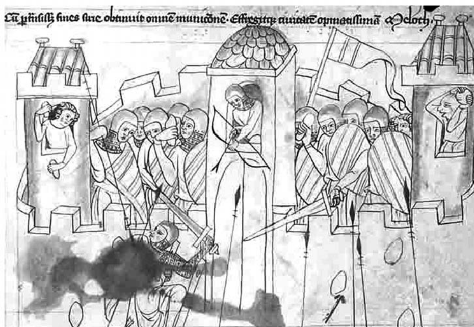
Obr. 3 Lukostrelec so šípom s vidlicovitým hrotom. Velislavova biblia.

došlo k masovejším rozšíreniu technologicky zdokonalenej kuše až po roku 1 300 (Brych 1998, 55). Od vtedy začínajú v nálezovom materiáli pribúdať masívne, pre kušu charakteristické šípky s tulajkou (Krajčíc 2003, 187). Ako špecializovaný tvar sa vidlicové hroty napokon rozšírili na takmer celom území Európy a dostali sa aj na Britské ostrovy (Serdon 2005, 125-126, Fig. 46), pričom odzrkadlenie našli aj v dobovom výtvarnom prejave (napr. Šlauka 1995, frontispice; Serdon 2005, Fig. 99; obr. 4).