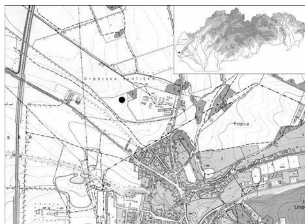
Obr. 1 Stupava – Urbárske sedličká, okres Malacky (mapa: 44-22-06, M – 1: 10000).

V prípade amforovitej nádoby nie je možné nálež jednoznačne označiť za súčasť výbavy pochádzajúcej z hrobového celku (Farkaš 1984, 4). V sondách I/82 a II/82, ktoré sa vyhlbili v okolí amforovitej nádoby, sa neobjavili stopy po ďalších hroboch alebo objektoch (obr. 2). Nádoba neobsahovala žiadne zvyšky prepálených kostrových zvyškov a nálezy podobného chronologického zaradenia sa v blízkosti nádoby tiež nevyskytli; jedine väčší fragment z nádoby bol objavený vo vnútri veľkej amforovitej nádoby. Nie je však vylúčené, vzhľadom na dobrý stav zachovania samotnej nádoby, že predmet mohol tvoriť časť hrobového inventára. Podľa Z. Farkaša sa na zničení či nezachovaní prípadných hrobov mohla podieľať orba, ktorá s výnimkou miesta nález zasahovala až do hĺbky 60 cm. Na základe neoverených správ sa na tomto mieste ešte pred 2. svetovou vojnou ojedinele nachádzali celé nádoby, v súčasnosti však stratené (Farkaš 1984, 3, 4).