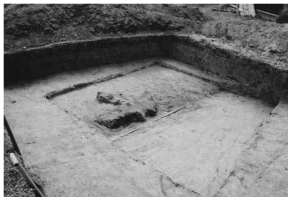
Obr. 2 Valaliky, časť Buzice. Dno zemnice na ploche s nálezmi keramiky z viacerých období praveku a včasnej doby historickej.