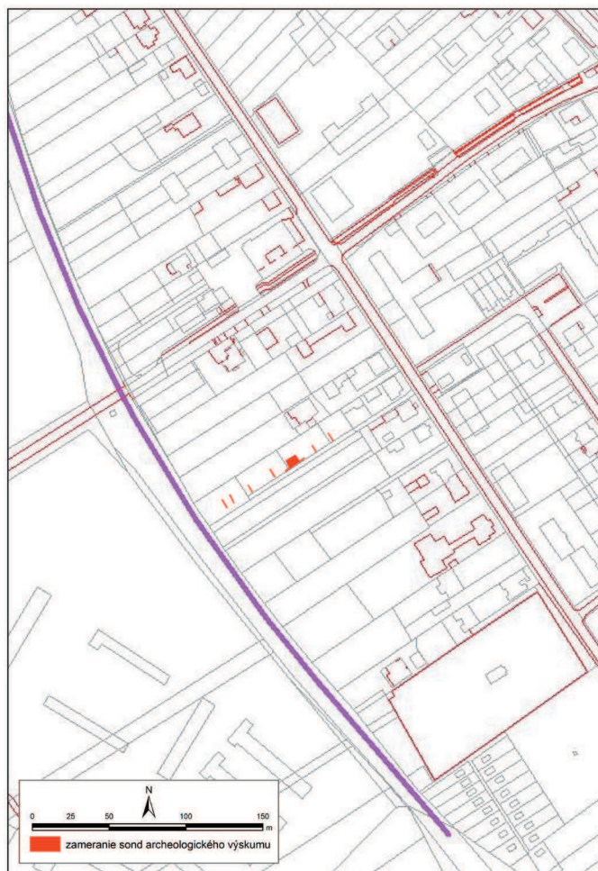
Obr. 1 Bratislava-Rusovce. Plán mestskej časti s vyznačenými prieskumnými rezmi (plán I. Kolčák).

Abb. 1 Bratislava-Rusovce. Stadtteilplan mit markierten Sonden-Schnitten (Plan: I. Kolčák).