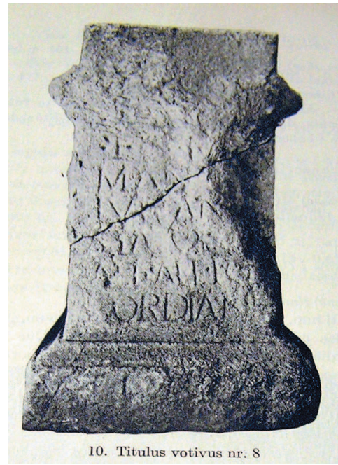
10. Titulus votivus nr. 8