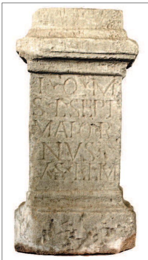
Obr. 4 Bratislava-Rusovce. Kamenný oltárík s nápisom. Abb. 4 Bratislava-Rusovce. Steinaltar mit Inschrift.

Preklad: Jupiterovi najlepšíemu a najvyššiemu zasvätil Lucius Septimus Maiorinus, sľub splnil dobrovoľne, rád a podľa zásluhy.