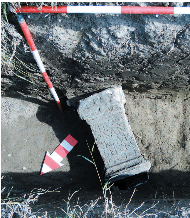
Obr. 3 Bratislava-Rusovce. Kamenný oltár v pôvodnej polohe. Abb. 3 Bratislava-Rusovce. Steinaltar in ursprünglicher Lage.

Bádaniu a publikovaniu rímskych kamenných pamiatok z Gerulaty a iných oblastí Slovenska je venovaných niekoľko publikácií ( Schmidtová/Jezná/Kozubová 2005; Žák-Matyasowszky 2003; Hošek 1985; Ratimorská 1984 a iné). Všetky vyššie uvedené publikácie obsahujú katalógy, v ktorých sú zverejnené potrebné informácie k jednotlivým pamiatkam. Doterajšie kamenné pamiatky z Rusoviec boli objavené v oblasti kastela (prevažne poloha Bergl) alebo