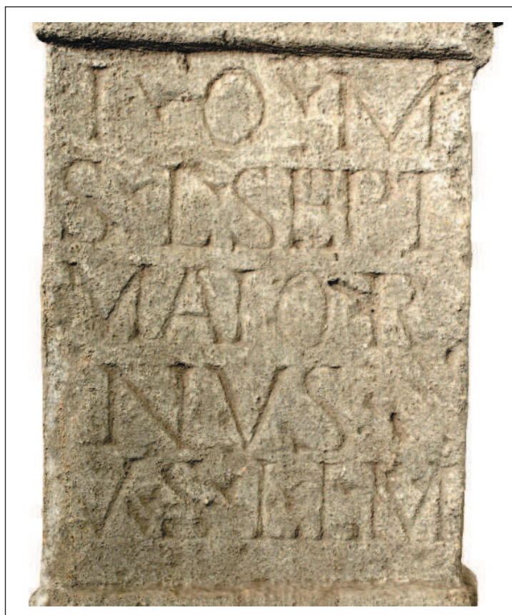
Obr. 5 Bratislava-Rusovce. Nápisová strana kamenného oltáríka. Abb. 5 Bratislava-Rusovce. Die beschriftete Seite des Steinaltars.