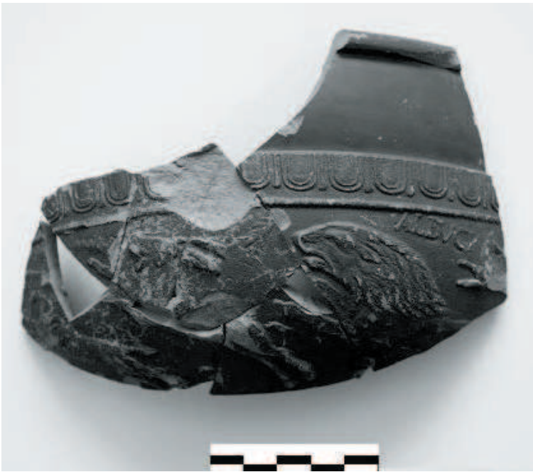
Obr. 6 Bratislava-Rusovce. Terra sigillata z príslušného rigolu. Abb. 6 Bratislava-Rusovce. Terra Sigillata von der angrenzenden Rigole.