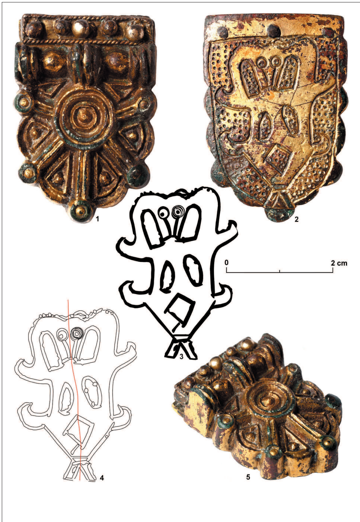
Obr. 2. Břeclav – Pohansko. 1: nákončie opasku z prednej strany; 2: zo zadnej strany; 3: prekreslenie výjavu; 4: obrysové prekreslenie výjavu a jeho delenie; 5: horná a bočná časť nákončia.

Pic. 2. Břeclav – Pohansko. 1: strap end of the belt from the front, 2: from the back, 3: Scene sketched in, 4: outlined sketch of the scene and its composition, 5: upper and side part of the strap end.