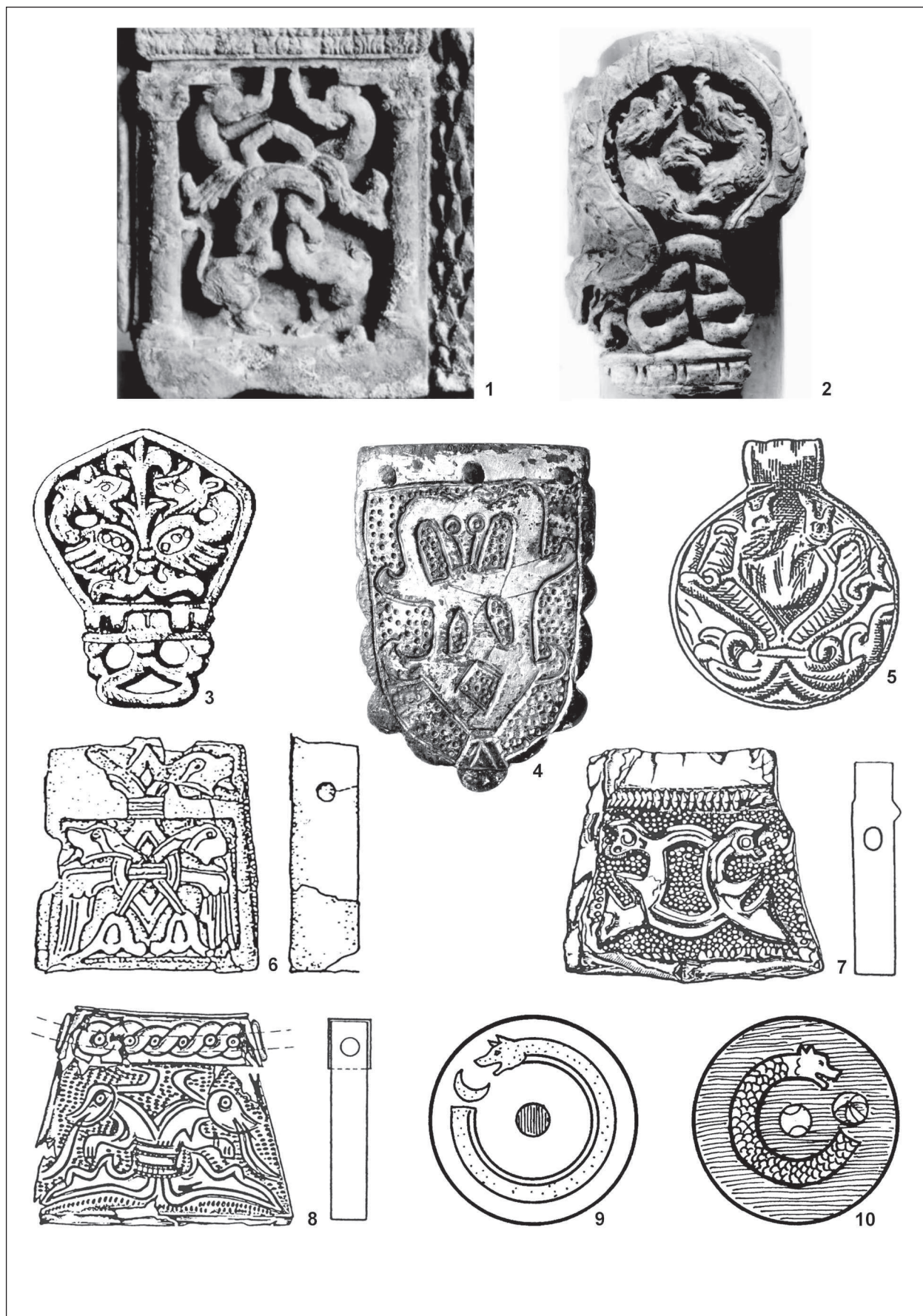
Obr. 4. Dračie bytosti. 1: Gandhára; 2: Pendžikent; 3: dolný Don; 4: Břeclav – Pohansko; 5: Gnezdovo; 6: Dobroměřice; 7: Žatec; 8: Klecany; 9: motív na štíte markomanskej jazdy rímskej armády; 10: motív na štíte rímskej armády bez určenia jednotky. 1, 2: podľa Santoro 2006; 3: podľa Vida 2000; 4: foto AÚ AV ČR Brno, v. v. i, 5-8: podľa Profantová/Šilhová 2010; 9, 10: podľa Nickel 1991.

Pic. 4. Dragon-like creatures. 1: Gandhara, 2: Panjakent, 3: lower Don, 4: Břeclav – Pohansko, 5: Gnezdovo, 6: Dobroměřice, 7: Žatec, 8: Klecany, 9: motif on the shield of the Marcomannic cavalry of the Roman army; 10: motif on a shield of the Roman army without further details. According to 1, 2: Santoro 2006, 3: Vida 2000, 4: photograph Institute of Archaeology, Academy of Sciences ČR Brno, v.v.i, 5 – 8: Profantová/Šilhová 2010, 9, 10: Nickel 1991.