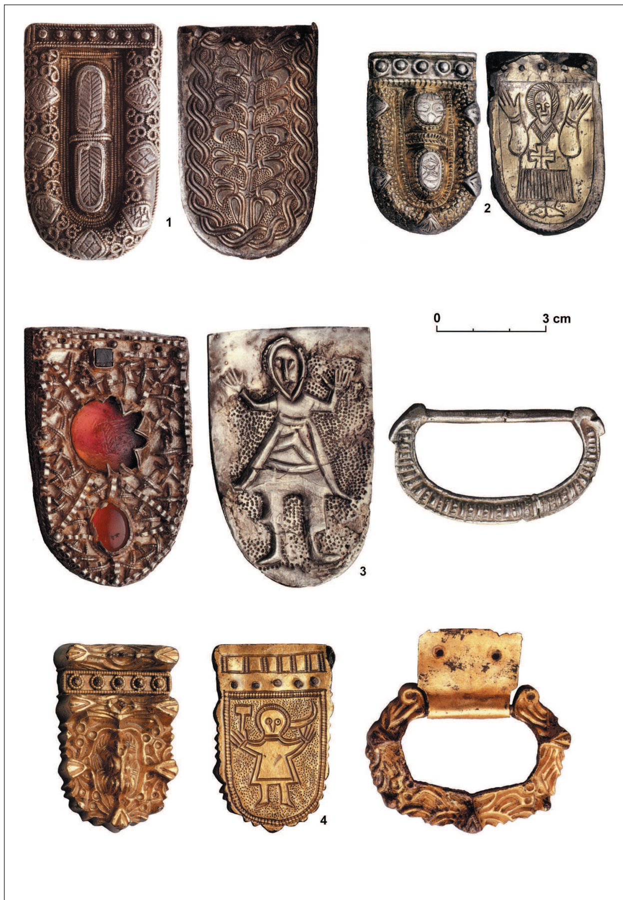
Obr. 3. Mikulčice, výber honosných súčasti opaskov. 1: hrob 433 (3. kostol); 2: hrob 100 (2. kostol); 3: hrob 390 (3. kostol); 4: hrob 240 (3. kostol). Podľa Wieczorek/Hinz 2000 , upravené.