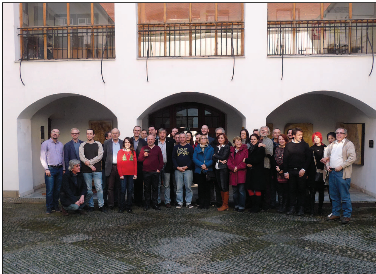
Obr. 2. Účastníci kolokvia na nádvorí SNM-Archeologického múzea.

Der Vergleich der Funde von verschiedenen Regionen zeigte sich für die weitere Forschung sehr nützlich, unter anderem auch beim Auftischen der Fragen, an die man bei der analytischen Bearbeitung der Keramik denken sollte. Es wurde nicht nur eine große geographische Streuung des Vorkommens rädchenverzierter Keramik bestätigt, aber auch eine relativ breite chronologische Skala, die die Zeit zwischen dem 1. bis 3. Jahrhundert nach Chr. einnimmt.