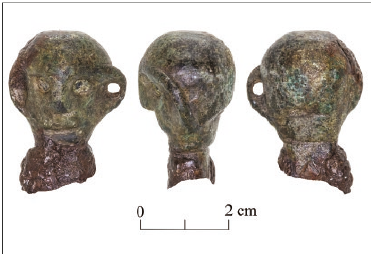
Obr. 1. Tvrdošovce, poloha Včelíny. Fragment bimetalického predmetu s antropomorfnou plastikou (foto I. Furugláš).

Plastika bola súčasťou bimetalického predmetu – v spodnej časti je spojená so železnou tyčinkou, ktorá sa zachovala len z časti. Predmet je evidovaný v zbierkach SNM-Archeologického múzea pod evid. č. AP 95 211.