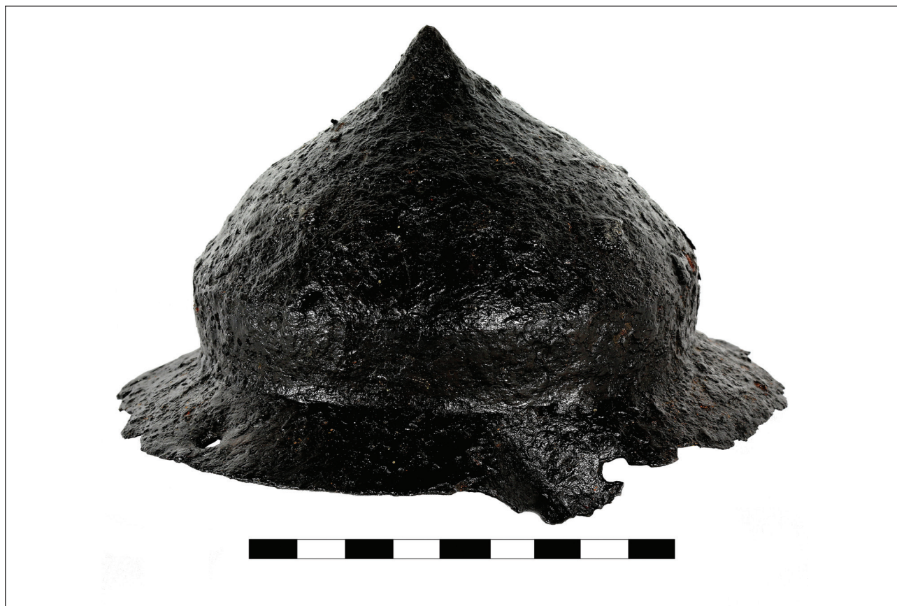
Obr. 1. Hontianske Nemce – Malé Orlie. Železná štítová puklica.