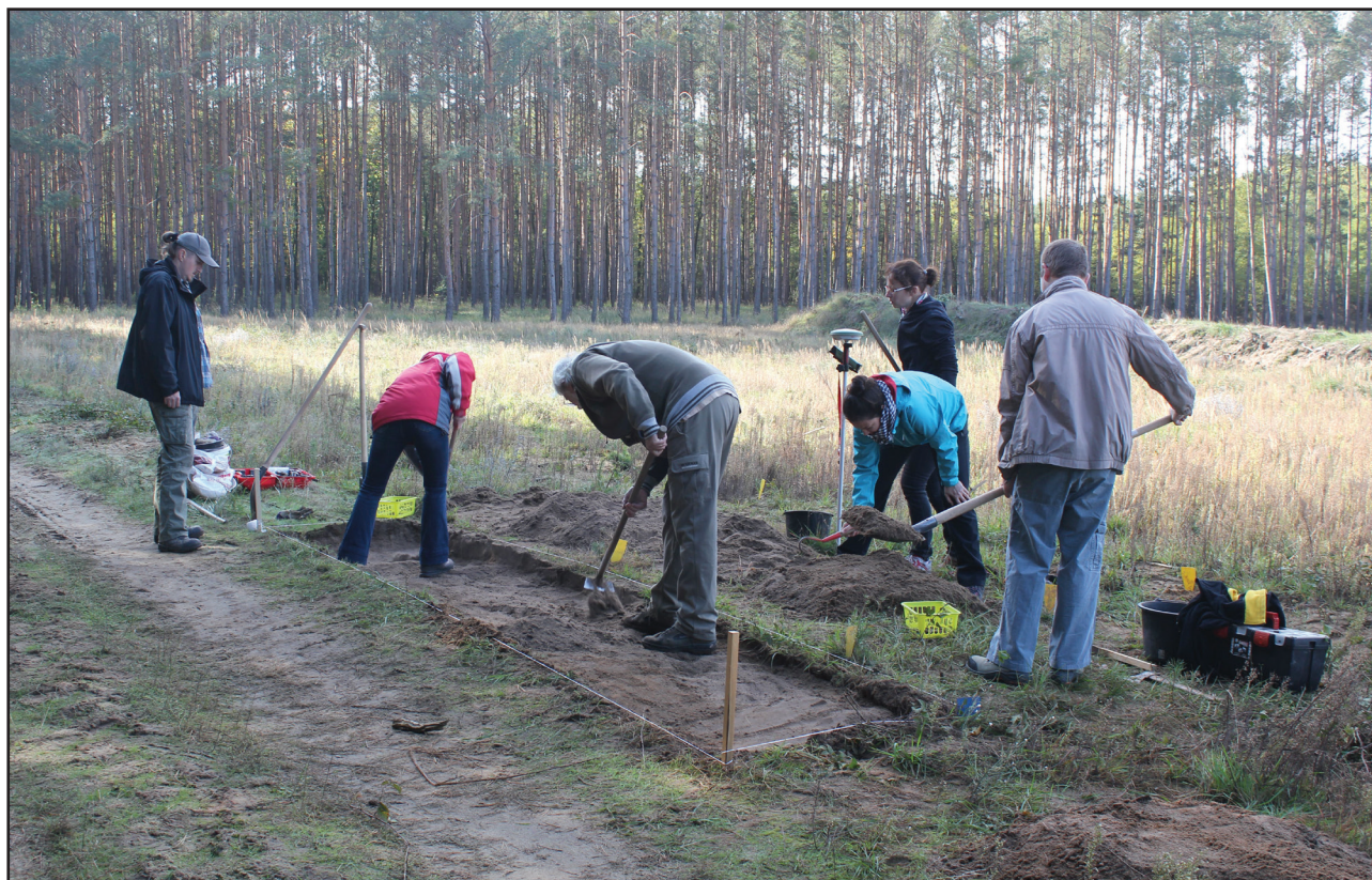
Obr. 2. Závod, okr. Malacky. Zisťovacia sondáž na mieste koncentrácie nálezov.