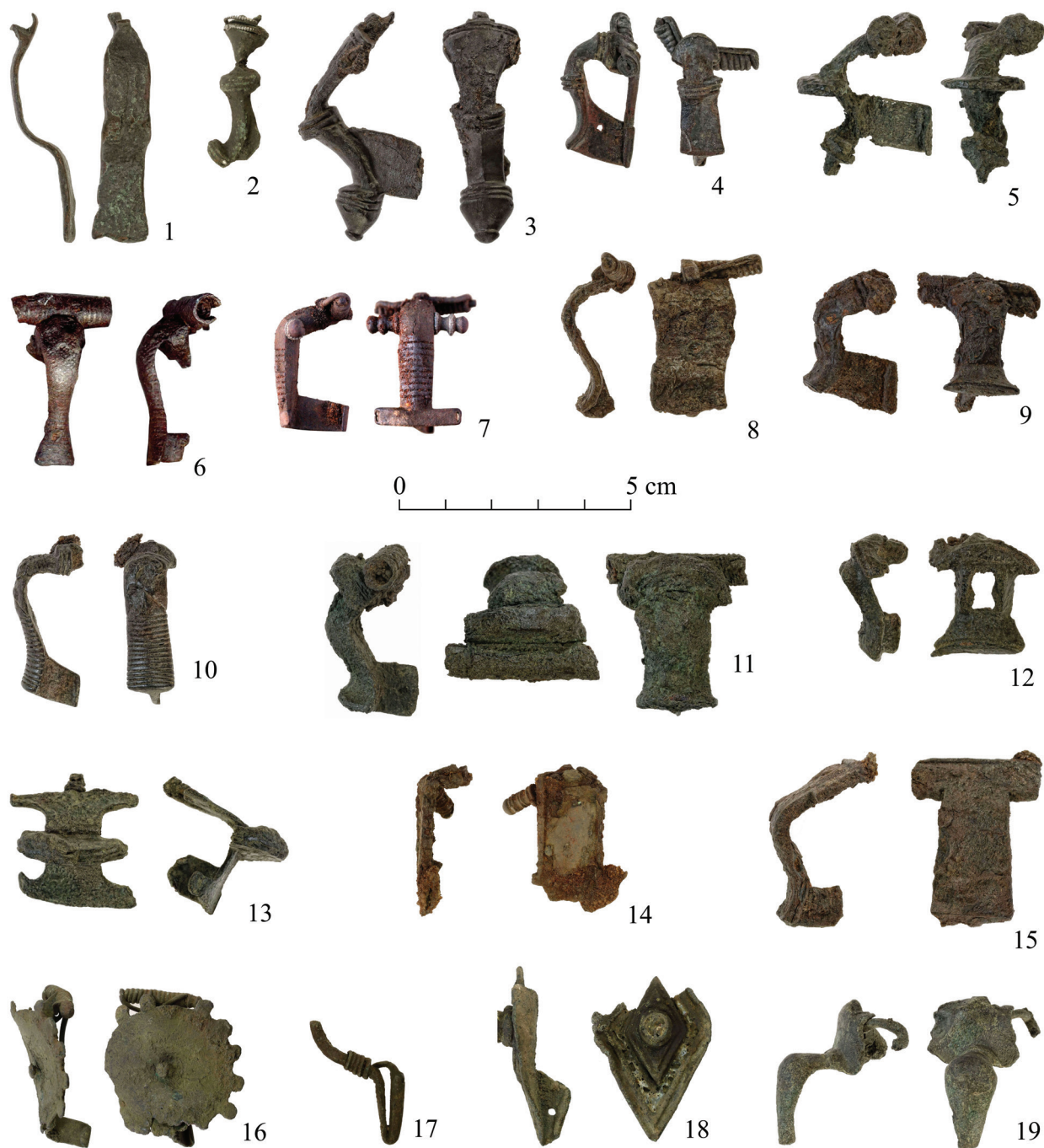
Obr. 3. Závod, okr. Malacky. Výber nálezov spôn: 1, 2, 4, 5, 8, 11-13, 16-19 bronz; 3, 6, 7, 9, 10, 14, 15 železo.