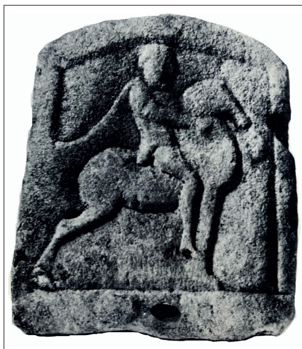
Obr. 3. Reliéf s vyobrazením Tráckeho jazdca zo zbierky Archeologického múzea v Sofii ( Venedikov 1979 ).

Otázka datovania plastík z SNM – AM zostáva otvorená. Schematická podoba plastík vedie k ich staršiemu datovaniu, avšak pravdepodobnejšie je uvažovať o ich vzniku a rozšírení zrejme v období rímskej okupácie čiernomorskej oblasti, s najväčším rozšírením od 2. do 3. storočia po Kr., k čomu napomáhajú iné analogické nálezy na kamenných pamiatkach. Treba podotknúť, že je zachovaný neúmerne počet ikonografických vyobrazení jazdca na mramorových a kamenných pamiatkach (obr. 3), v porovnaní s dosiaľ známym počtom bronzových figúrok a plastík. Dôvodom by mohla byť vysvetlenie, že sa plastiky častejšie stávali terčom obchodu so starožitnosťami.