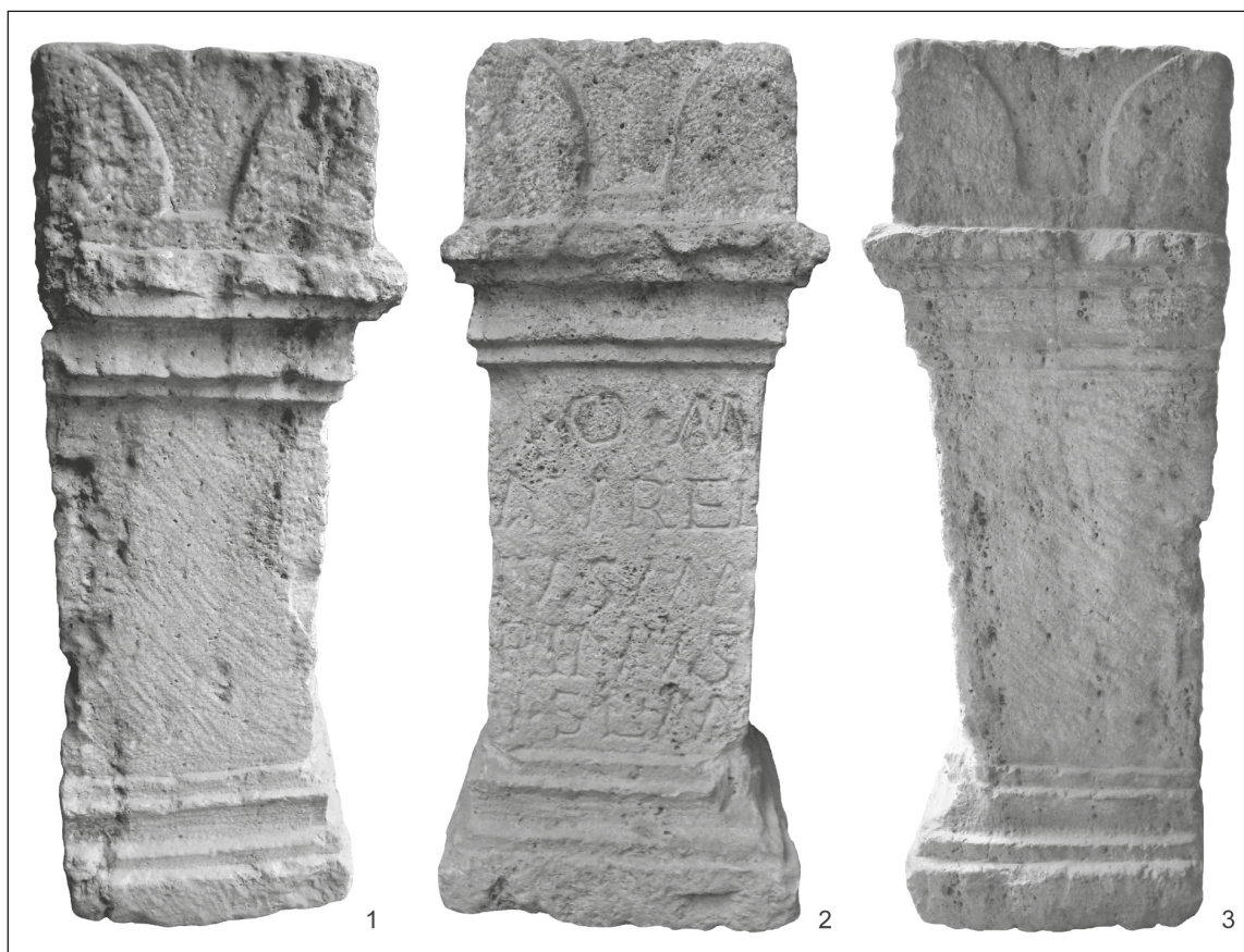
Obr. 1. Iža (okr. Komárno), rímsky votívny oltár, pohľad na čelnú a dve bočné strany.