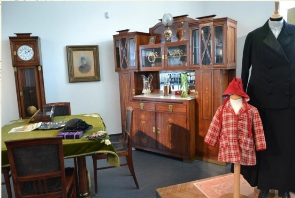
Obr. 4 Meštiansky interiér