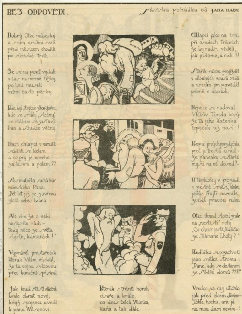
Obr. 5 Výsek z časopisu Houpačky, báseň