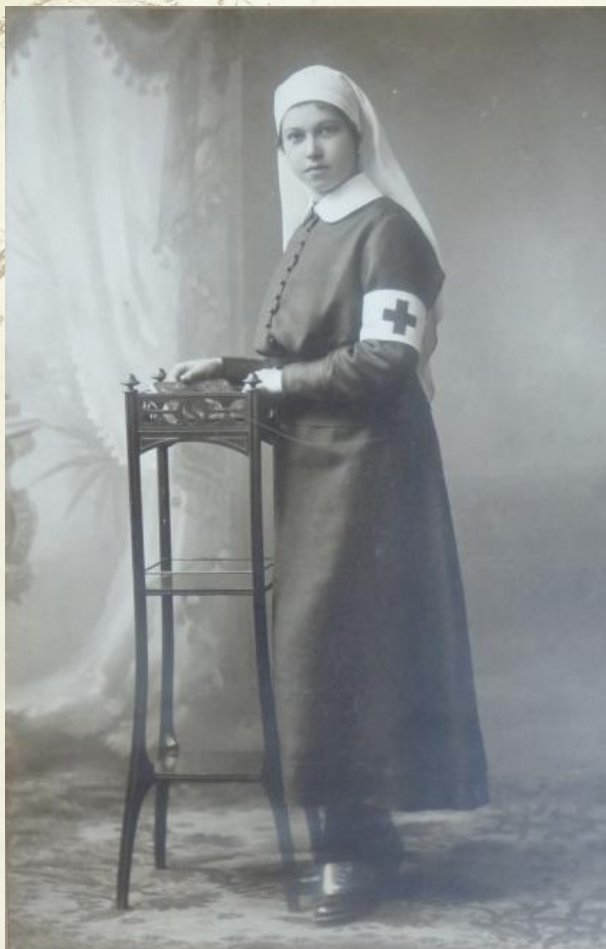
Obr. 1 Fotografia, zdravotná sestra z Červeného kríža