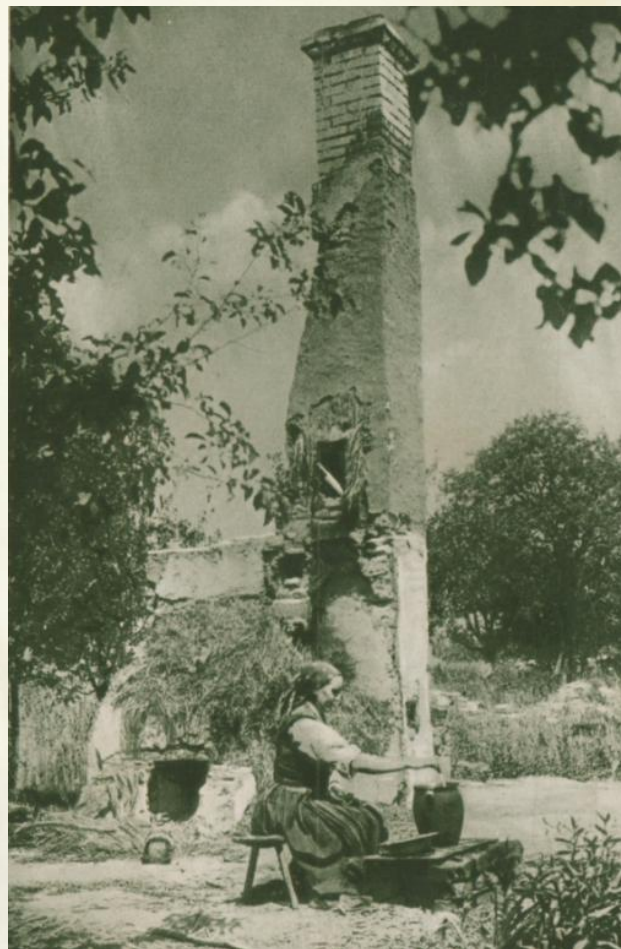
Obr. 2 Fotografia, žena pri práci