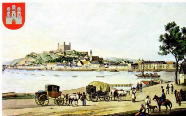
Bratislava okolo roku 1810

Západné Slovensko vzhľadom na svoju geografickú polohu malo vždy blízke kontakty s nemeckými krajinami. Samotná Bratislava mala na začiatku 20. storočia prevahu nemeckého obyvateľstva. Územie okolo rieky Moravy bolo už od 10. storočia priesečníkom slovanskej, maďarskej a nemeckej jazykovej oblasti.