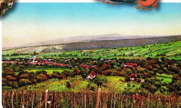
Limbach okolo roku 1930