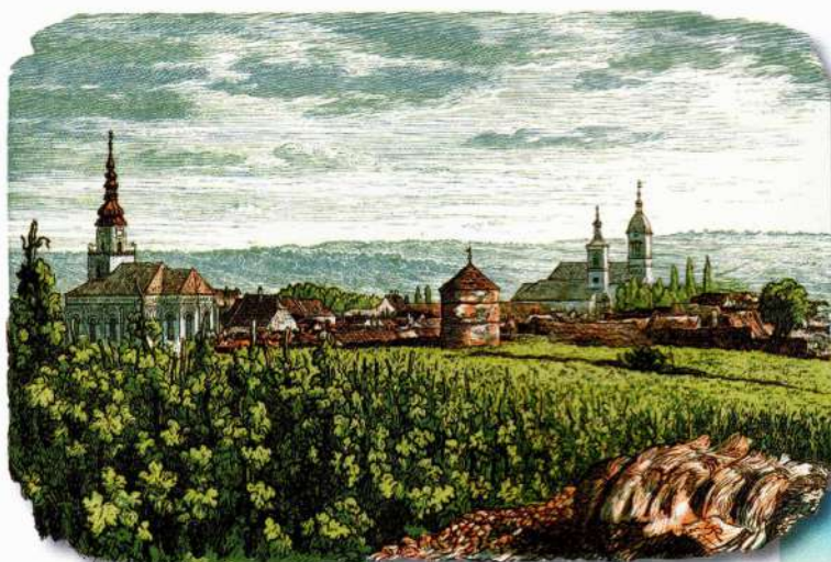
Modra v 19. storočí

Na severe sa na Bratislavu napájali vinohradnícke „slobodné kráľovské mestá“ – Svätý Jur, Pezinok a Modra, ktoré si uchovávali svoju starú nemeckú tradíciu. Vznikajú malokarpatské vinohradnícke mestečká a dediny ako Grinava, Limbach, Cajla, ktoré získali právo zakladať vinohrady a voliť si richtára. Nemci sem v 13. a 14. storočí doniesli nielen nové odrody, metódy pestovania a spracovania viniča, ale aj zvykové vinohradnícke právo. Dodnes tu používaná vinohradnícka a vinárska terminológia, ako aj miestne chotárne názvy, majú často nemecký pôvod.