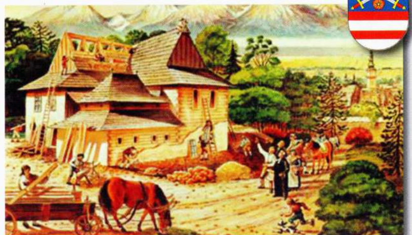
Kežmarok začiatkom 18. storočia

Poznáš názov najrozsiahlejšieho hradu v strednej Európe, ktorý je súčasťou Svetového kultúrneho a prírodného dedičstva UNESCO?