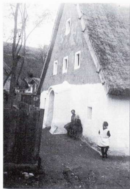
Habánske domy zo začiatku 20. storočia