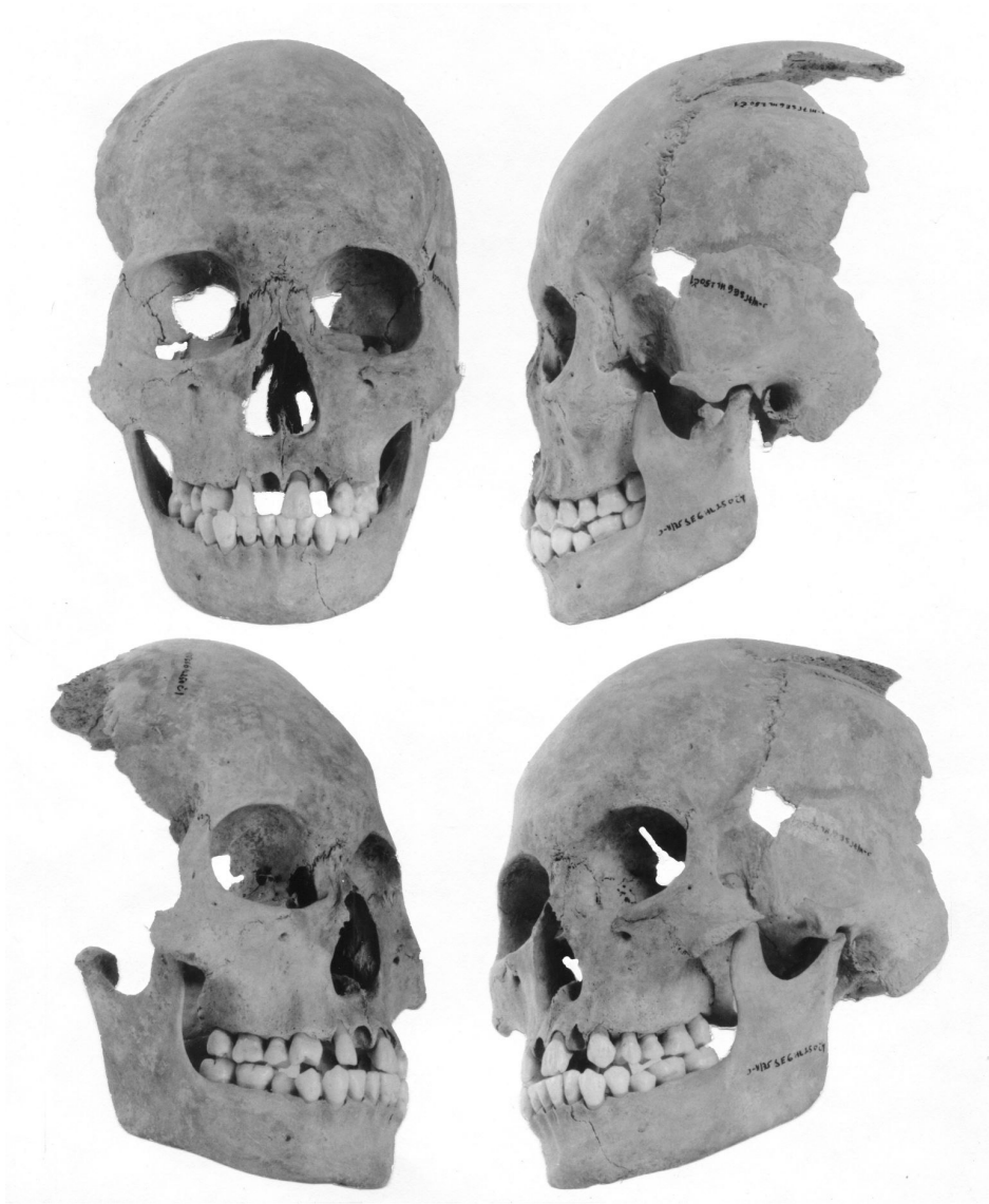
Obr. 2. Devín 1, obdobie sťahovania národov, lebka chlapca mongoloidného etnika, infans II/juvenis (13 – 15 rokov), pohľad spredu, z boku a z poloprofilu (Šefčáková et al.1994).