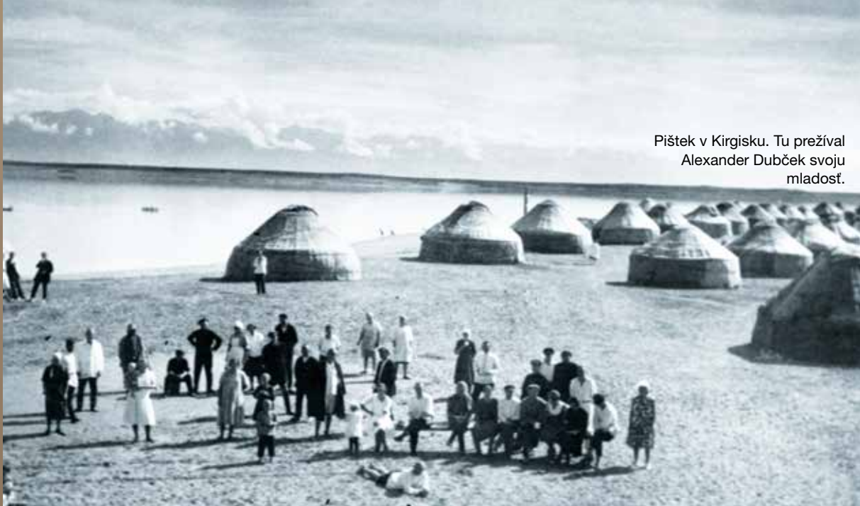
Pištek v Kirgisku. Tu prežíval Alexander Dubček svoju mladosť.

Alexander Dubček neskôr spomínal na často opakovaný povzdych: „Tak tu sme na konci sveta“. Interhelpisti žili v Pišteku na jednej strane bohatým spoločenským spolkovým životom, na druhej strane sa čoraz častejšie vyskytovali prípady zatknutia členov družstva. Dospievajúci Dubček bol zrejme aj svedkom prejazdu transportu ukrajinských roľníkov – tzv. kulakov. Keď vlak zastavil v Pišteku, ktorý sa vtedy nazýval Frunze, vypadávali z otvorených vagónov mŕtvol. Dubček údajne vtedy rozmýšľal, akých zločinov sa museli dopustiť títo nepriatelia štátu, keď takto dopadli. Nedokázal pochopiť, že títo ľudia neboli trestaní za to, čo spáchali, ale za to, čím boli. Táto skúsenosť zrejme ovplyvnila budúceho politika, aby pre komunizmus hľadal ľudskejšiu tvár. Koniec koncov to, že sa človek môže stať pre komunistický režim nepohodným len pre to, čím je, musel pochopiť už v roku 1938. Vtedy nový zákon o občianstve umožnil zostať v ZSSR len cudzincom, ktorí sa vzdajú svojho pôvodného občianstva. To, že uprednostnil návrat na Slovensko svedčí o tom, že možnosť budovať socialistickú spoločnosť v Sovietskom zväze mu nestála zato, aby sa vzdal československého občianstva.