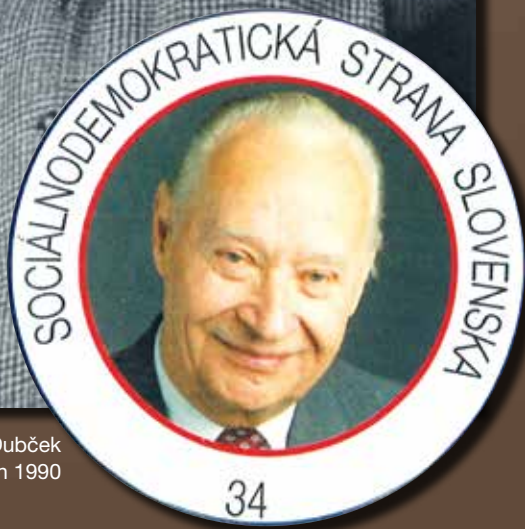
Odznak Sociálno-demokratickej strany Slovenska za ktorú Dubček kandidoval v prvých parlamentných voľbách 1990