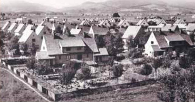
Pohľad na obytnú štvrť v továrenskej kolónii v Dubnici začiatok 20. storočia

Alexander Dubček sa s rodinou vrátil na Slovensko v novembri 1938. Do Československa teda prichádzal práve v čase, keď sa v štáte stále viac presadzovali nedemokratické a postupne totalitné prvky. Na škodu Alexandra Dubčeka boli navrátilci zo Sovietskeho zväzu nepriateľmi štátnej moci aj komunisti. Je preto pochopiteľné, že sa Dubček zapojil do ilegálnej činnosti komunistickej strany. V tom čase bol Dubček zamestnancom Škodovky v Dubnici a vodcom ilegálnej závodnej odbojovej bunky.