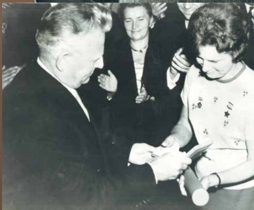
Prezident Antonín Novotný víta sovietsku kozmonautku, prvú ženu sveta vo vesmíre Valentínu Tereškovú pri jej návšteve Bratislavy v auguste 1963

V procese s tzv. buržoáznymi nacionalistami bol odsúdený a neskôr rehabilitovaný Gustáv Husák – budúci prezident Československej socialistickej republiky v rokoch 1975 - 1989