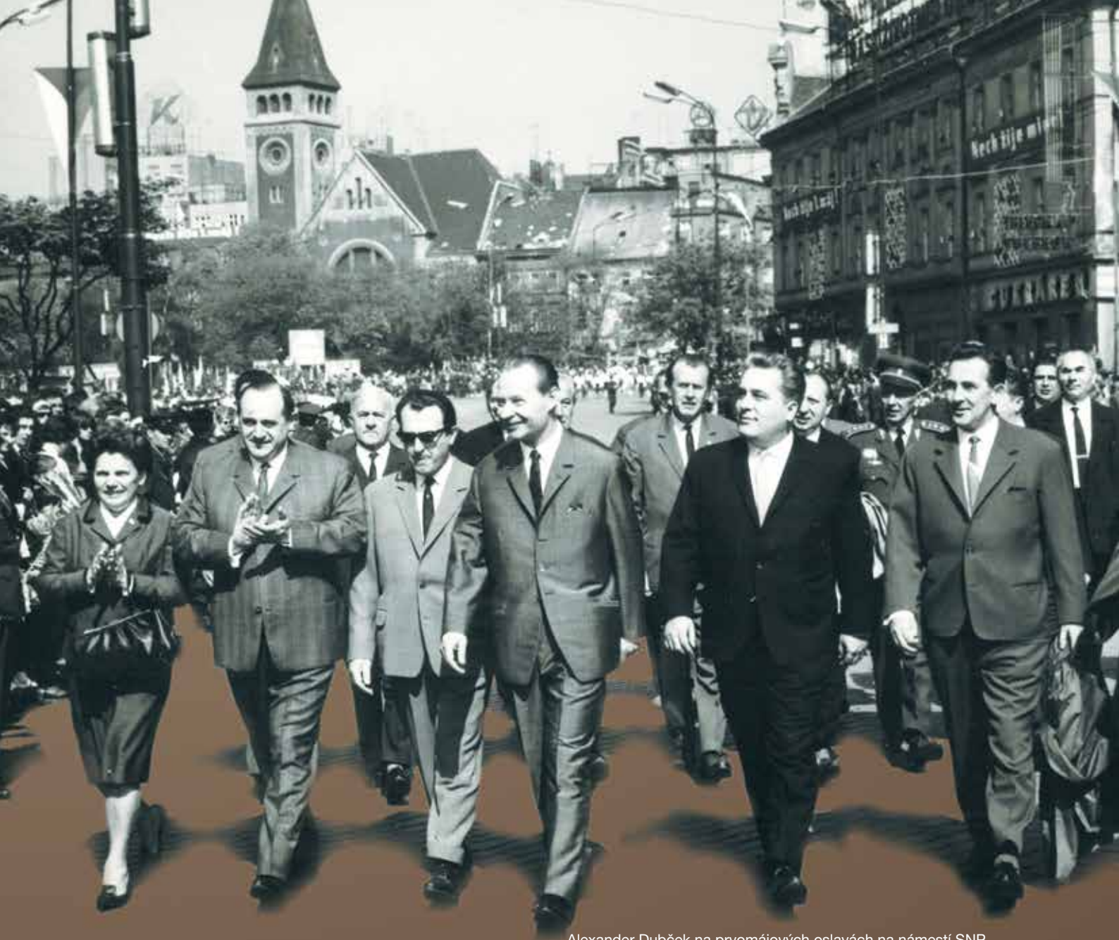
Alexander Dubček na prvomájových oslavách na námestí SNP v Bratislave v roku 1966

V Komunistickej strane Československa bolo dlhodobo zaužívané, že sa všetky personálne otázky riešili v úzkej spolupráci a po odsúhlasení s najvyššími sovietskymi predstaviteľmi. „Eto vaše delo“ - „Je to vaša vec“. To bola veta, ktorou odpovedal v decembri 1967 Leonid Iljič Brežnev, 1. tajomník ÚV KSSZ na snahu Antonína Novotného nájsť podporu v Sovietskom zväze. Touto vetou dal Brežnev vedeniu KSČ jasný odkaz. Hneď v januári 1968 Ústredný výbor KSČ odvolal Antonína Novotného z postu 1. tajomníka KSČ. Následne plénum Ústredného výboru zvolilo za nového 1. tajomníka KSČ Alexandra Dubčeka.