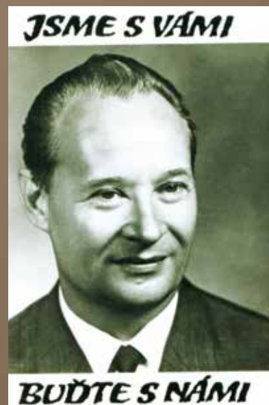
Fotografia Sme s Vami, buďte s nami!

V Československu zatiaľ narážali vojaci interventov na jednoznačné odmietnutie obyvateľstva, ktoré podporovalo reformy a nastupujúcu demokratizáciu socializmu. Ľudia písali množstvo podporných rezolúcií, listov a pohľadníc, vyrábali letáky a pouličné nápisy. Z Alexandra Dubčeka sa stál národný hrdina. Československé vedenie zatiaľ rokovalo so sovietskym o podmienkach vzťahov po okupácii. Dubček pomerne dlho patril k tým, ktorí odmietali zotrvanie sovietskych vojsk v Československu. Na naliehanie kolegov a pod tlakom rôznych okolností napokon moskovský protokol podpísal.