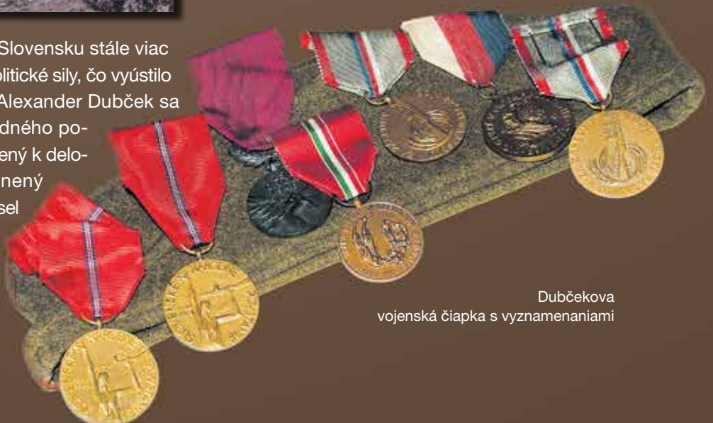
Dubčekova vojenská čiapka s vyznamenaniami