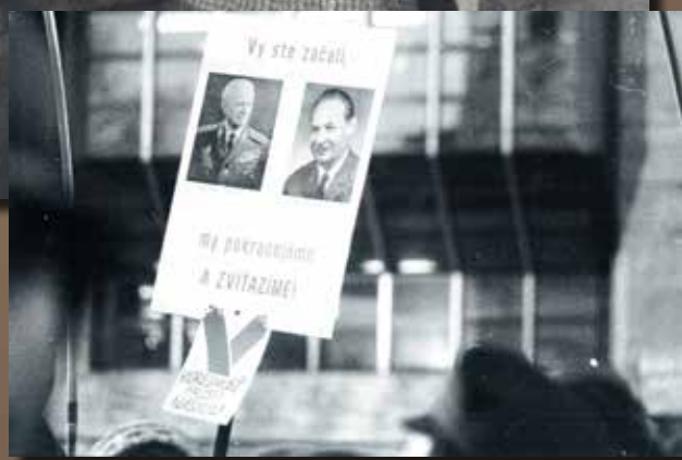
Transparent z novembra 1989

Dubček napriek sklamaniam prijal ponuku stať sa predsedom Federálneho zhromaždenia ČSFR. Túto funkciu zastával od zvolenia vo Federálnom zhromaždení 28. decembra 1989 až do svojej predčasnej tragickej smrti.