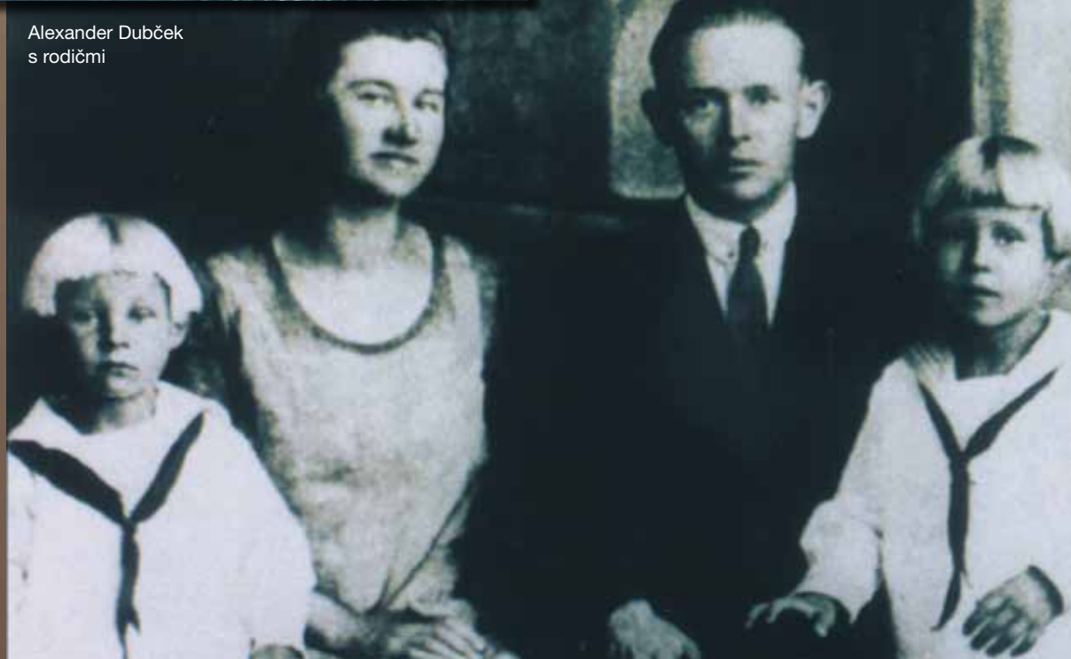
Alexander Dubček s rodičmi