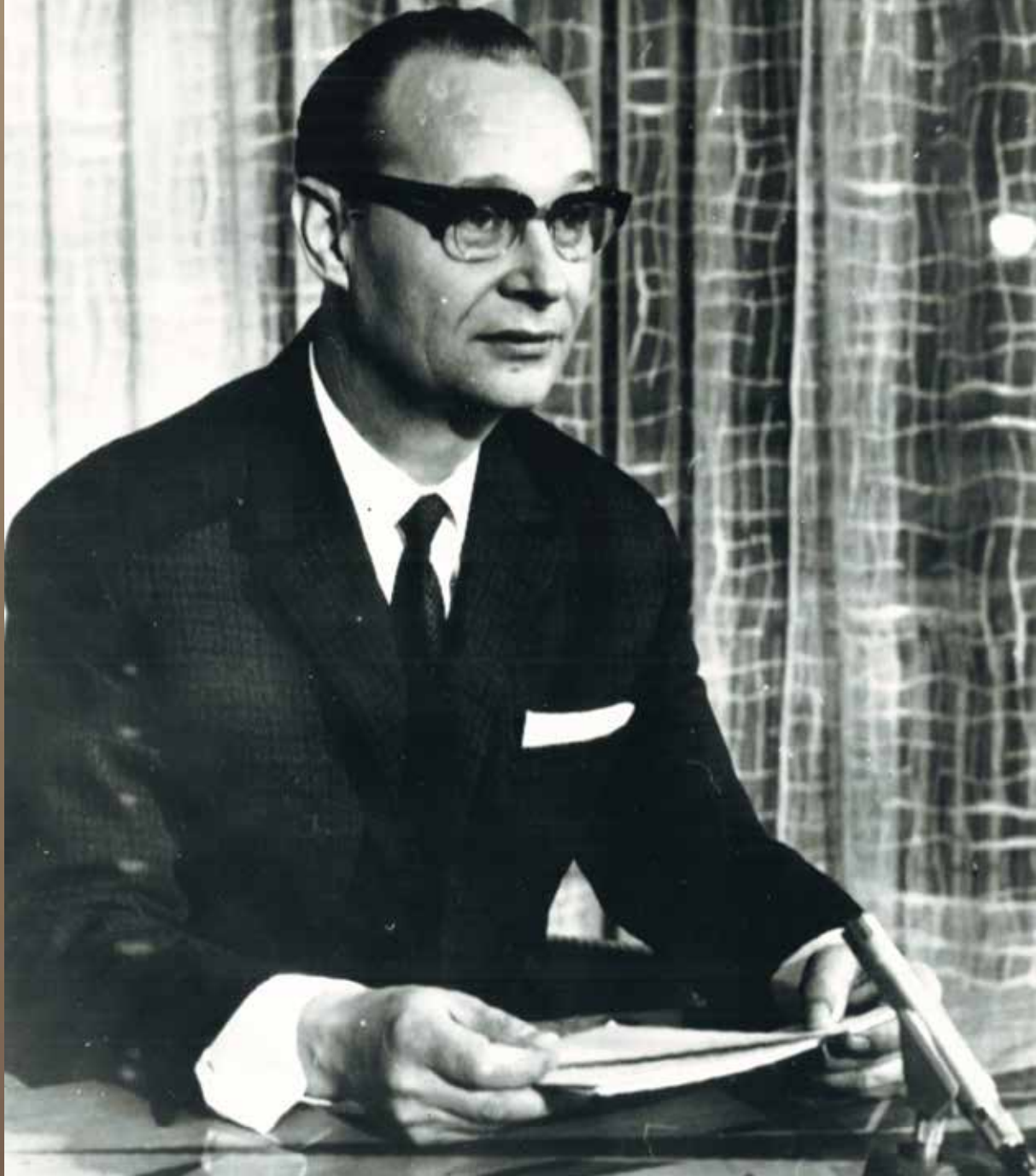
Jeden z posledných televíznych prejavov Alexandra Dubčeka 8. 1. 1969

Po odvolaní z funkcie 1. tajomníka KSČ a predsedu Federálneho zhromaždenia sa stal veľvyslancom v Turecku. Aj Dubčekovi však muselo byť jasné, že tento pomalý zostup neskončí na veľvyslanectve. V júni 1970 prestal byť pre novú moc zaujímavý a tá ho odvolala. V nasledujúcom období zažíval Alexander Dubček na vlastnej koži všetky nepríjemnosti, ktoré boli typické pre znova sa utužujúci komunistický režim. Problémy s hľadaním zamestnania, každodenné sledovanie štátnou bezpečnosťou, ktorá sa snažila o jeho izoláciu od okolia, ale aj odopieranie zdravotnej starostlivosti. Dubček vtedy pracoval za minimálny plat v Západoslovenských štátnych lesoch v Bratislave-Krasňanoch ako mechanizátor.