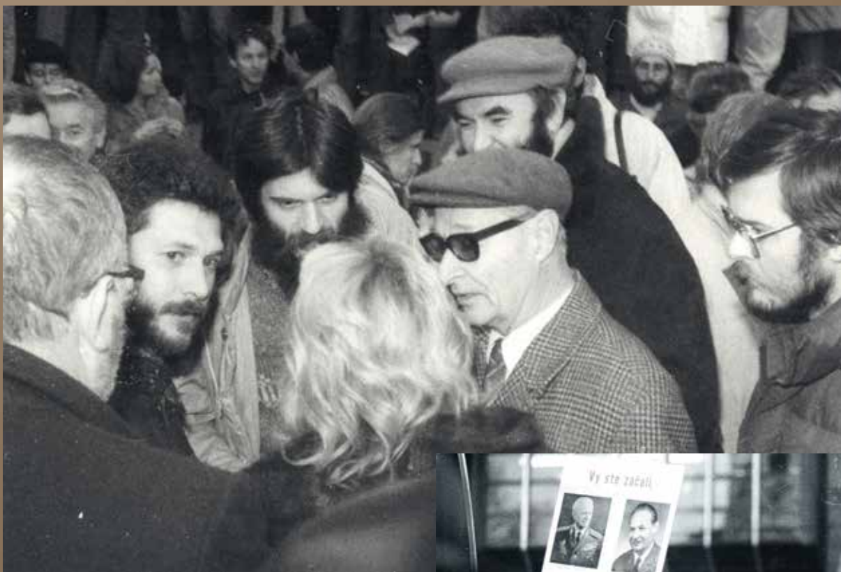
Dubček medzi ľuďmi počas demonštrácii v novembri 1989 v Bratislave

Dubček napriek sklamaniam prijal ponuku stať sa predsedom Federálneho zhromaždenia ČSFR. Túto funkciu zastával od zvolenia vo Federálnom zhromaždení 28. decembra 1989 až do svojej predčasnej tragickej smrti.