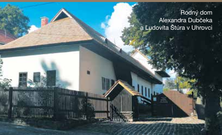
Rodný dom Alexandra Dubčeka a Ľudovíta Štúra v Uhrovci