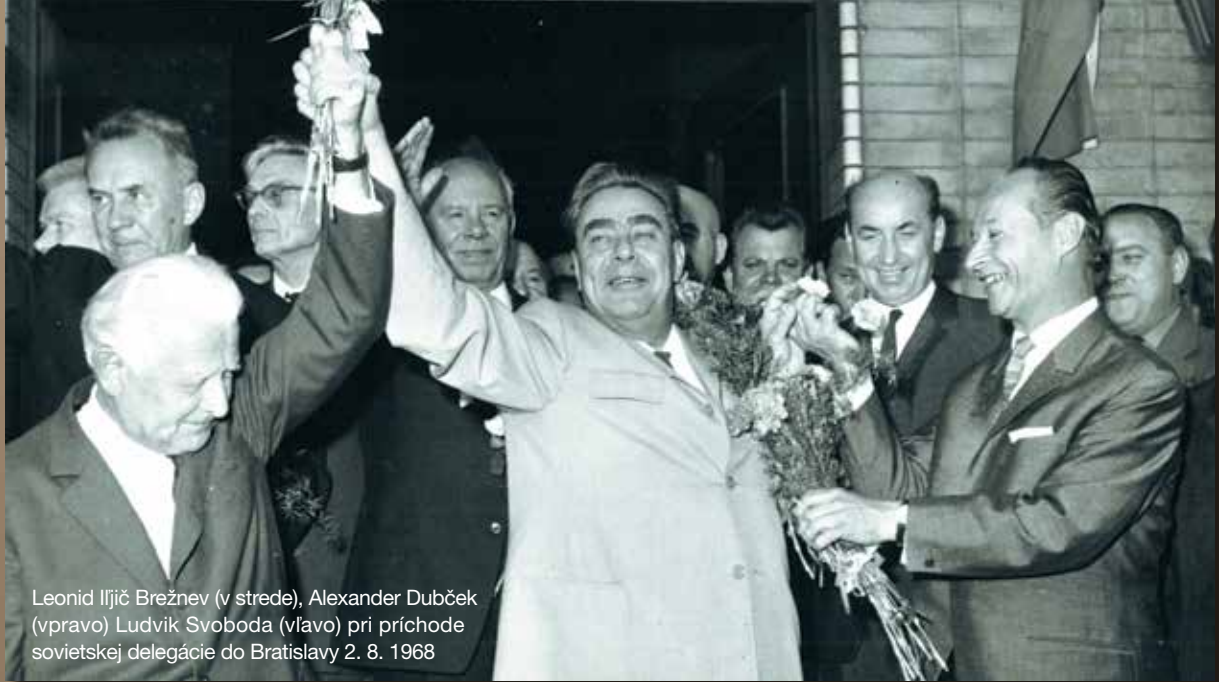
Leonid Iljič Brežnev (v strede), Alexander Dubček (vpravo) Ludvík Svoboda (vľavo) pri príchode sovietskej delegácie do Bratislavy 2. 8. 1968

Vedúci predstavitelia Sovietskeho zväzu s obavami sledovali demokratizačné snahy v Československu. Už v marci 1968 sa uskutočnila schôdzka predstaviteľov štátov Varšavskej zmluvy, na ktorej prvý raz zo strany znepokojených komunistických predstaviteľov zaznela otvorená kritika vývoja v Československu. Dubček vo svojich spomienkach uvádza, že výnimočne sa stretnutia zúčastnili i sovietski generáli. Hrozby pokračovali v podobe vojenských cvičení v Poľsku, NDR a na Šumave. Československí predstavitelia sa síce snažili zmierniť napätie rokovaním a preukazovaním dobrej vôle, to sa však nepodarilo ani na rokovaníach v Čiernej nad Tisou.