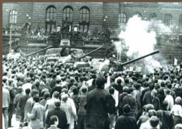
Vojská Varšavskej zmluvy pred Národným múzeom na Václavskom námestí v Prahe

Napriek presným prípravám a takmer perfektnému prevedeniu okupácie Československa vojenská operácia nespĺnila všetky ciele. Skutočnosť, že predsedníctvo ÚV KSČ útok odsúdilo a že sa nepodarilo vytvoriť kolaboračnú vládu, prinútila sovietskych predstaviteľov rokovať s legitímnymi predstaviteľmi Československa. Alexander Dubček spolu s ďalšími zajatcami boli odvezení do Moskvy, kde boli držaní v izolácii až do príchodu oficiálnej československej delegácie vedenej prezidentom Svobodom.