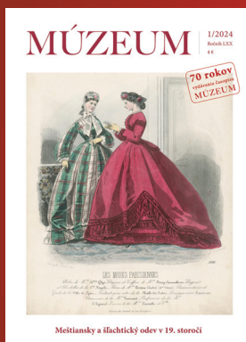
Meštiansky a šľachtický odev v 19. storočí