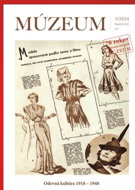
Odevná kultúra 1918 – 1948